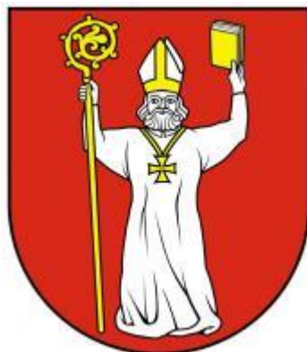
Erb obce Tekovské Lužany