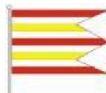
Vlajka obce Tekovské Lužany