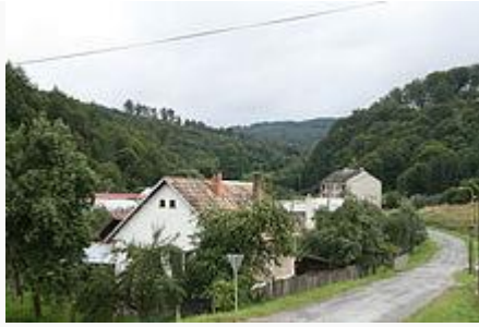
Údolie Prikrianky s chránennou krajinou oblasťou Východné Karpaty