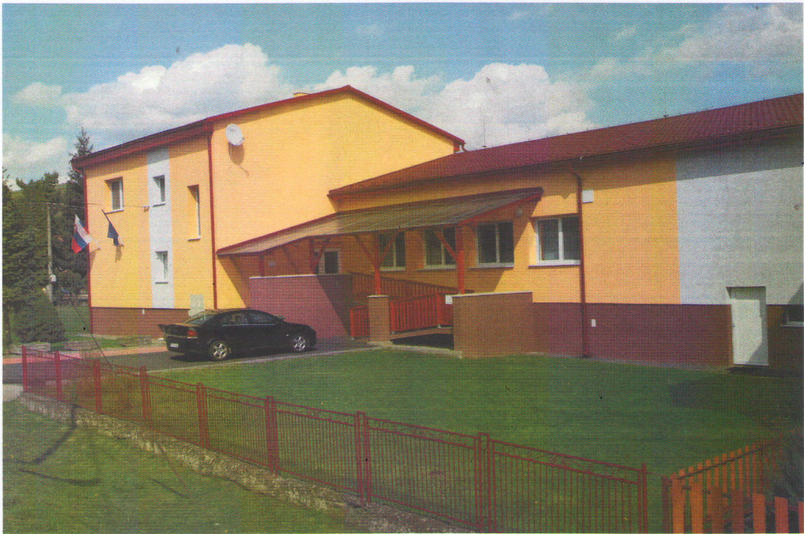
Budova kultúrneho domu po rekonštrukcii.

Výročná správa obce za rok 2015 je výsledkom našej poctivej práce a aktivít smerujúcich k rozvoju našej obce. Podarilo sa nám veľké dielo z projektu cezhraničnej spolupráce : Modernizácia a rozšírenie kultúrneho domu , ktoré bolo slávnostne otvorené 20.júna 2015 za účasti predstaviteľov z Poľska. Chcem vysloviť poďakovanie všetkým poslancom, ale aj zamestnancom, ktorí sa podieľali na realizácii tohto projektu. Zároveň chcem poďakovať aj tým občanom, ktorí nás pri tejto akcii podporili.