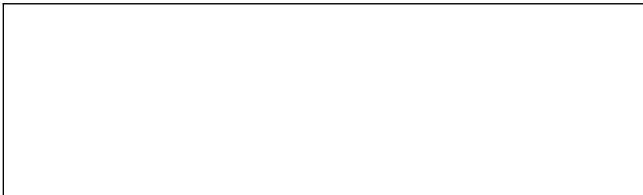
3. Informácie k časti F. písm. a) prílohy č. 3 o dlhodobom nehmotnom majetku Tabuľka č. 1