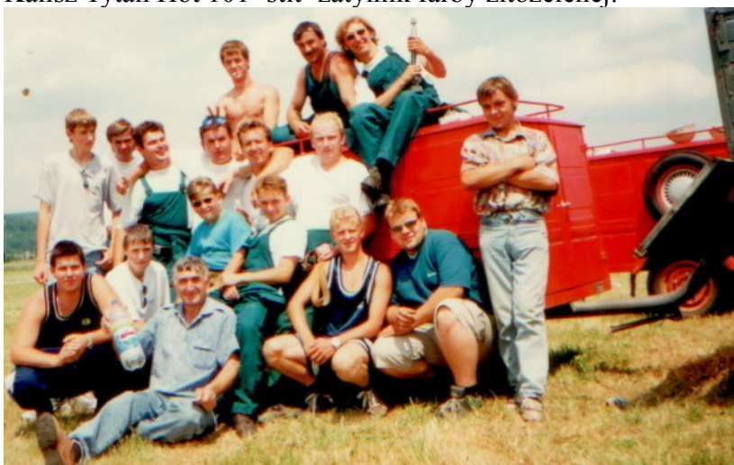
Dobrovoľný hasičský zbor z roku 2002

V priebehu roka 2016 DHZ dostal finančnú dotáciu určenú a prísne účelovo viazanú na zabezpečenie potrieb a akcieschopnosti vo výške 700,00 €, ktoré sa použili na zakúpenie 9 ks prilby Kalisz Tytan Hot 101+štit+zátylník farby žltozelenej.