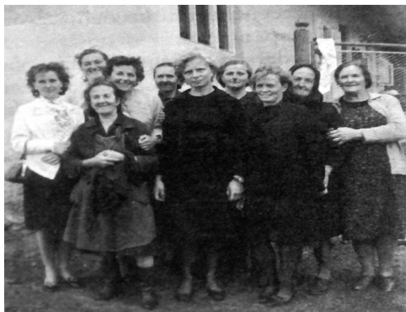
Táto fotografia vznikla pravdepodobne v 50 rokoch 20. storočia a vidíme na nej návštevu amerických migrantov v rodnej obci Koceľovce.