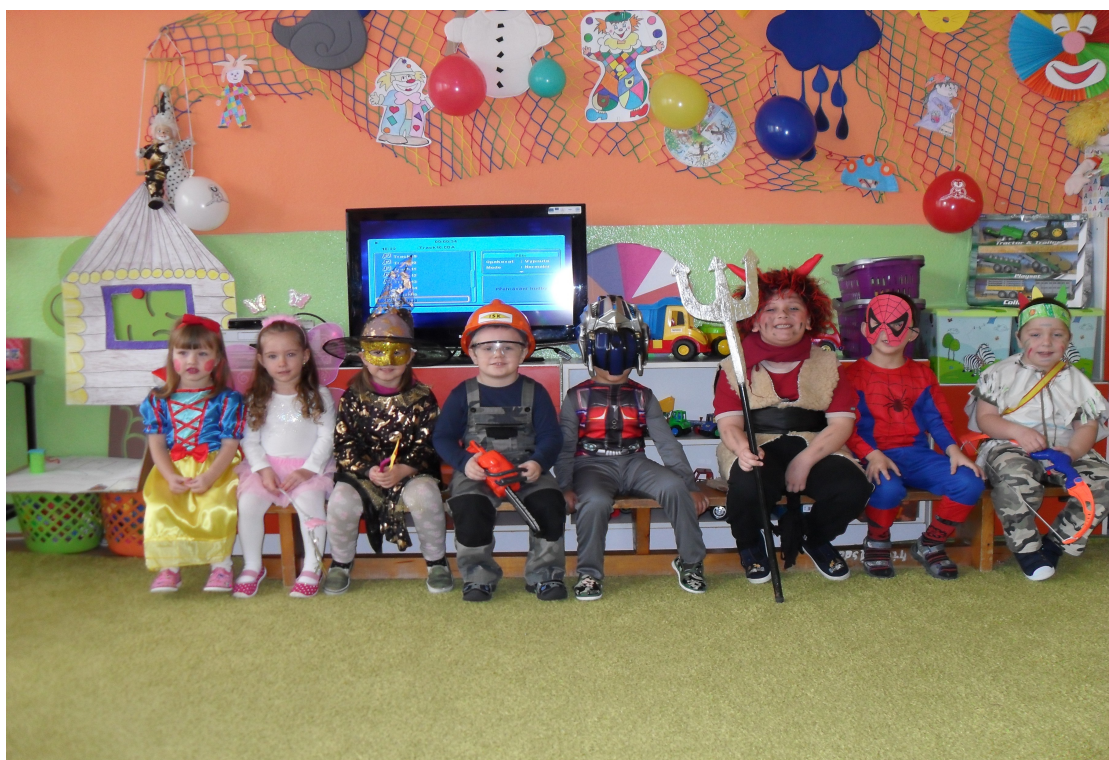
Maškarný ples v šk. roku 2015/2016