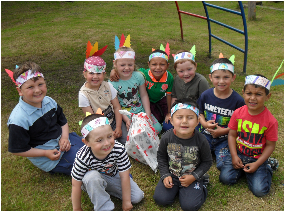
Deň detí v Materskej škole šk. rok 2014/2015