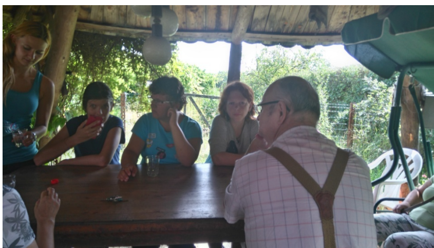
Výlet Maša - Slovenský raj