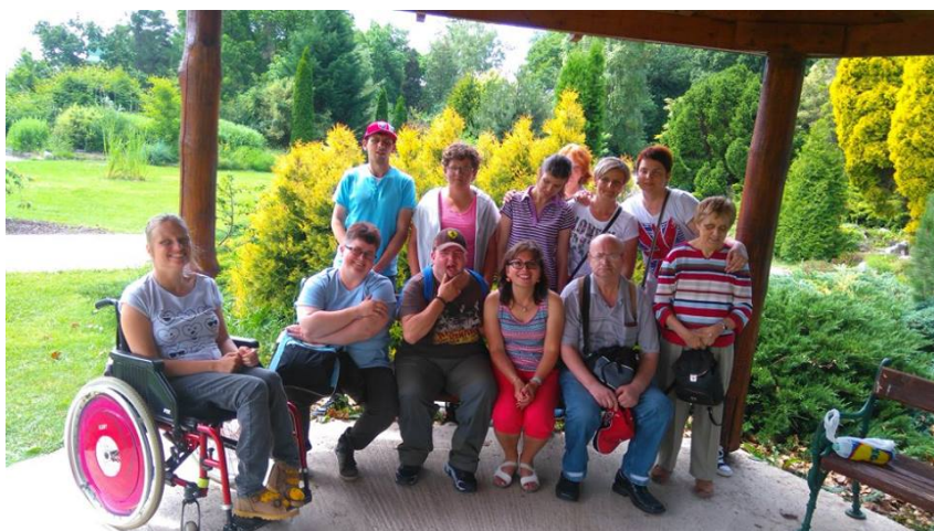
Výlet Košice - botanická záhrada