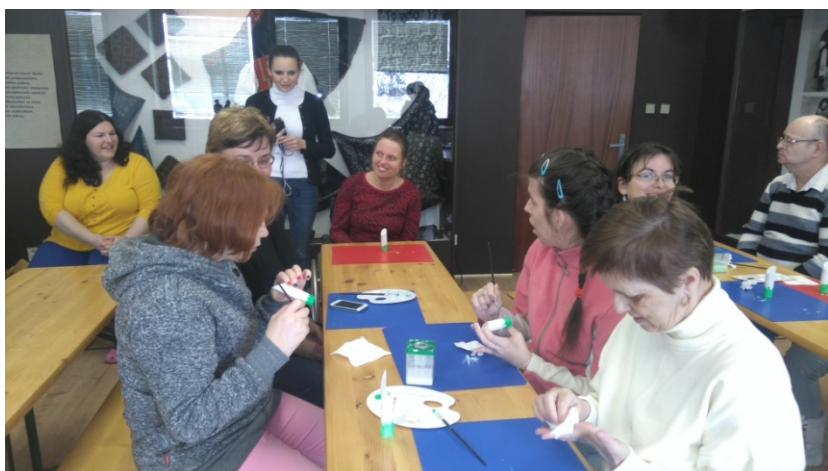
Múzeum Smižany - tvorivé dielne