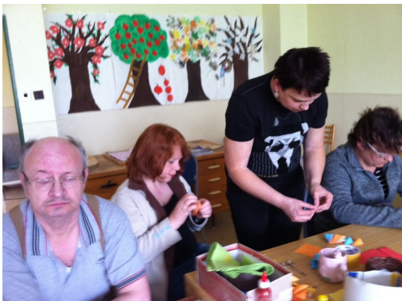
Tvorivá činnosť - práca s papierom