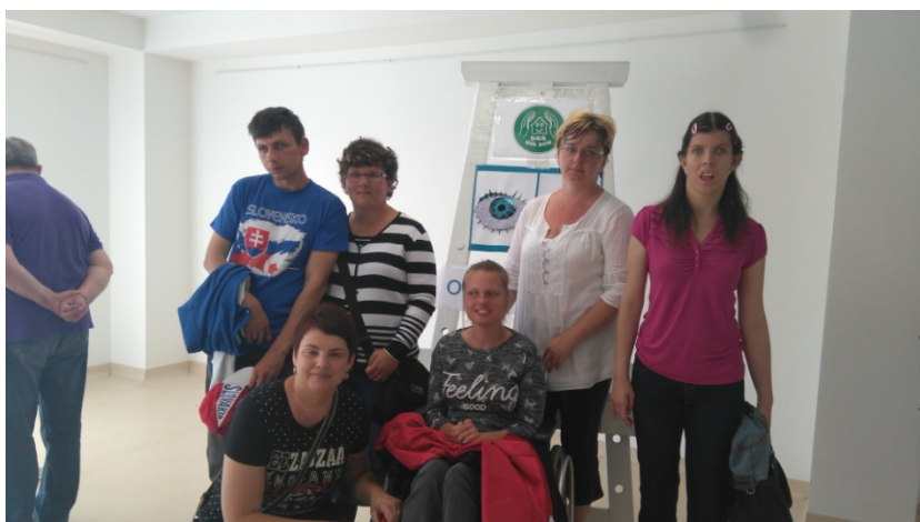
Multicentrum Spišská Nová Ves