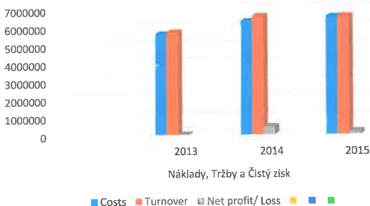
Náklady, Tržby a Čistý zisk

Počas tohto obdobia Spoločnosť vytvárala cash flow na uspokojovanie záväzkov a očakáva plnenie záväzkov takým istým spôsobom v ďalších rokoch.