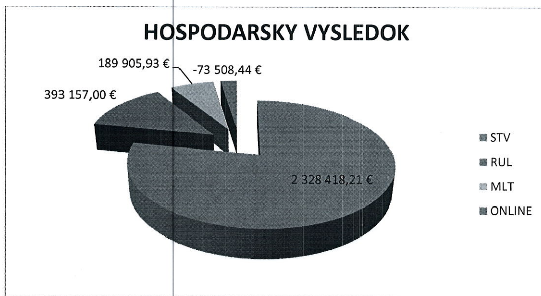
Graf č. 3 – hospodársky výsledok – finančné vyrovnanie