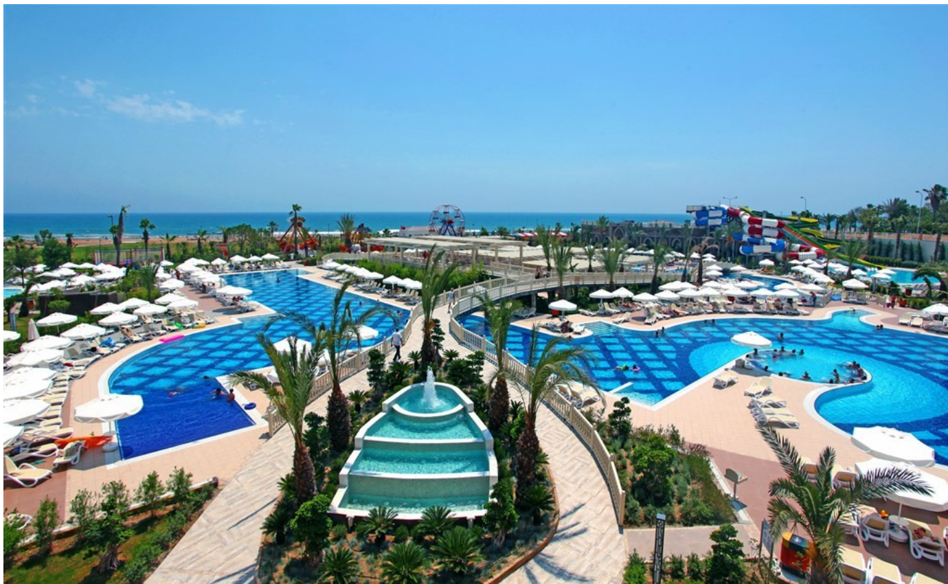
Royal Alhambra Palace, Turecko

Majoritným poskytovateľom charterovej leteckej dopravy bola spoločnosť Travel Service Praha. Voľnú časť kapacít poskytovala CK partnerským spoločnostiam TATRATOUR, KoalaTours, Seneca Tours a viacerým subchartererom. V menšej miere sme využili služby aj iných prepravcov spoločnosť Tailwind(Cyprus) . Lety do Spojených Arabských Emirátov boli zabezpečené cez spoločnosť Blue Sky Travel – Fly Dubai.