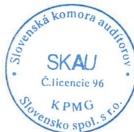
Zodpovedný audítor: Ing. Ľuboš Vančo Licencia SKAU č. 745

Audítorská spoločnosť: KPMG Slovensko spol. s r.o. Licencia SKAU č. 96