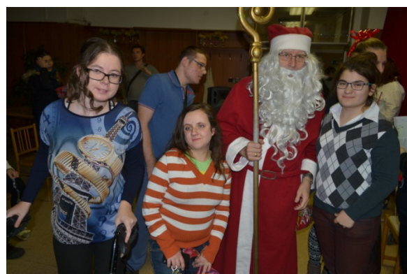
Mikuláš, Stredná odborná škola pre postihnuté deti, Mokrohajská 1, rok 2016