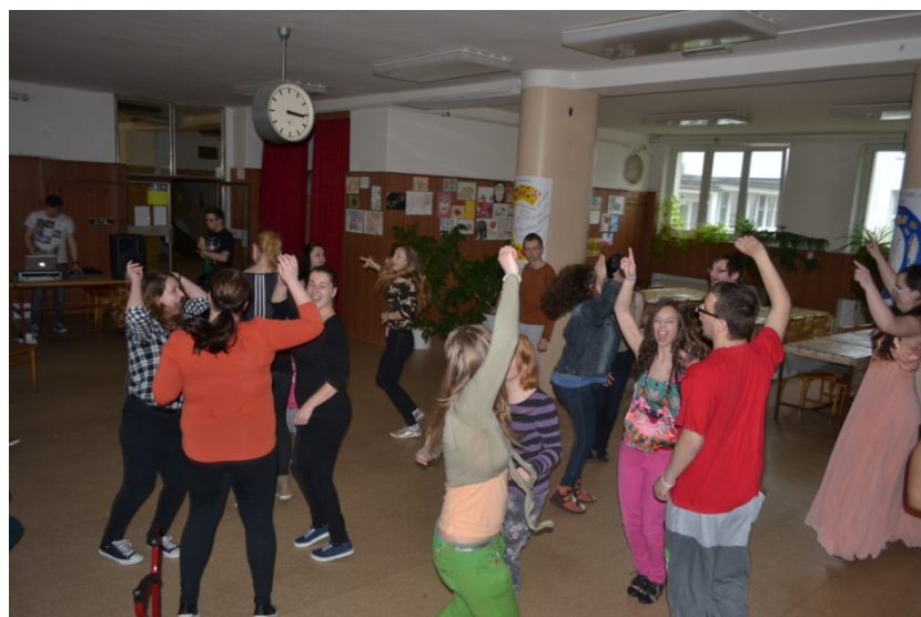
Slávik IPR, Stredná odborná škola pre postihnuté deti, Mokrohajská 1, rok 2016