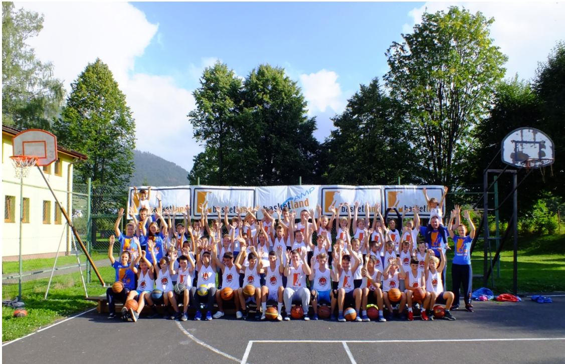
Kemp talentovaných mladších kategórií minibasketbalistov a žiakov MBK Karlovka Bratislava, Kvačany 2016