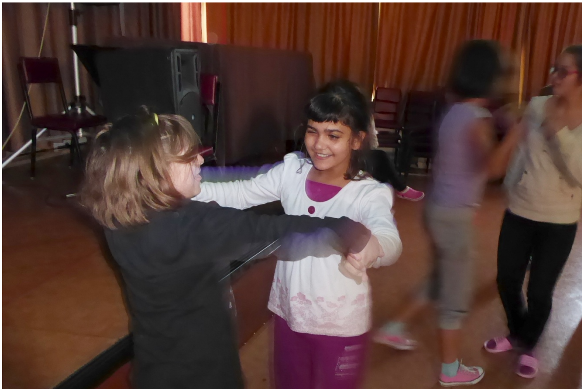
Spestrenie voľného času detí, Základná škola pre zrakovo postihnuté deti, Svrčia 6, rok 2016