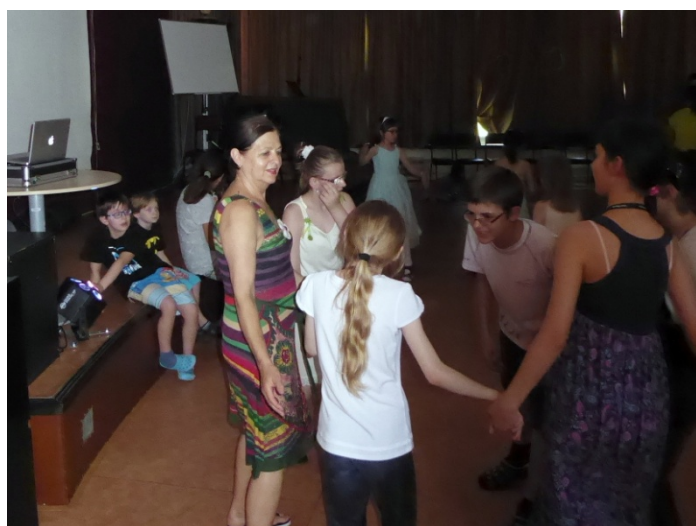
Ukončenie školského roka, Základná škola pre zrakovo postihnuté deti, Svrčia 6, rok 2016