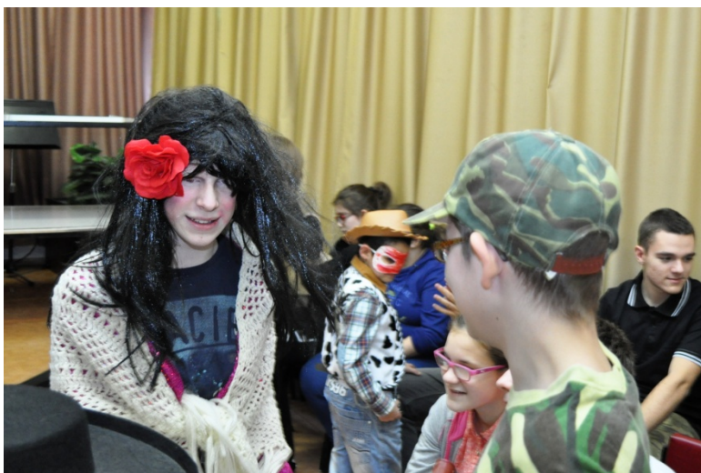
Karneval, Základná škola pre zrakovo postihnuté deti, Svrčia 6, rok 2016