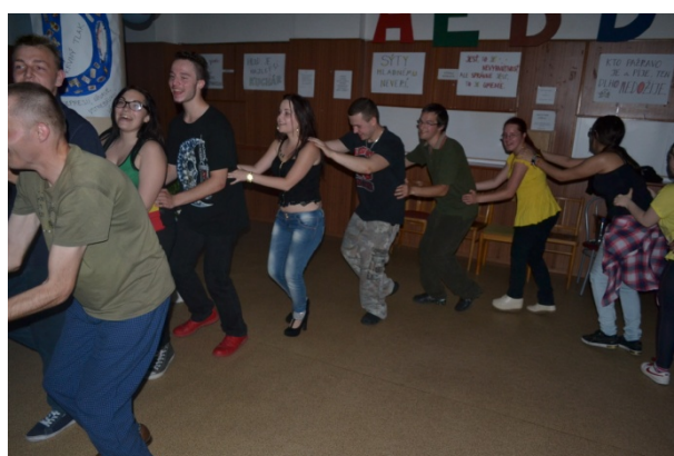
Juniáles, Stredná odborná škola pre postihnuté deti, Mokrohajská 1, rok 2016