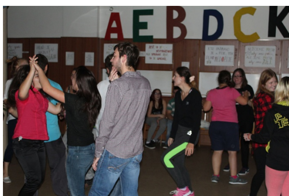
Imatrikulácia, Stredná odborná škola pre postihnuté deti, Mokrohajská 1, rok 2016