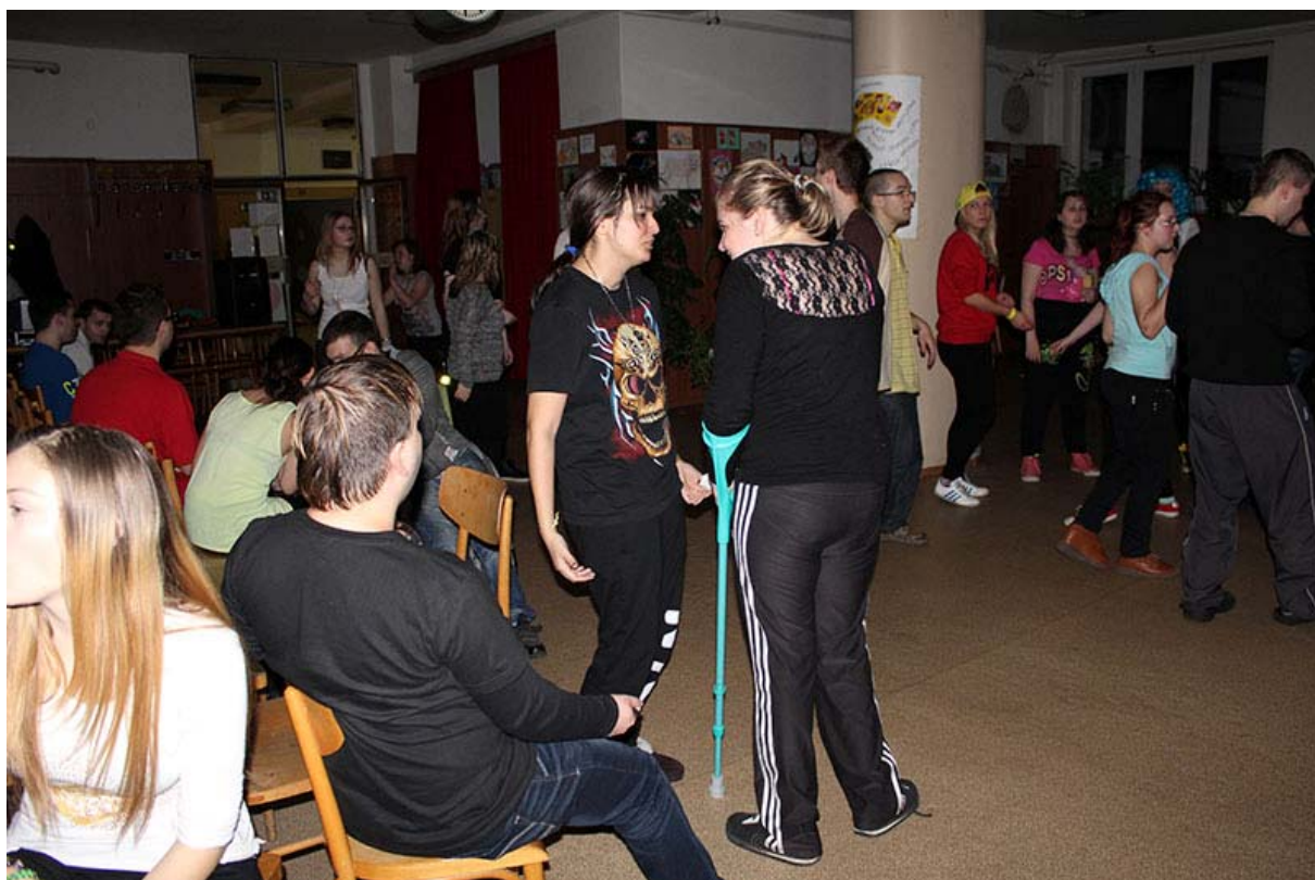
Karneval, Stredná odborná škola pre postihnuté deti, Mokrohajská 1, rok 2016