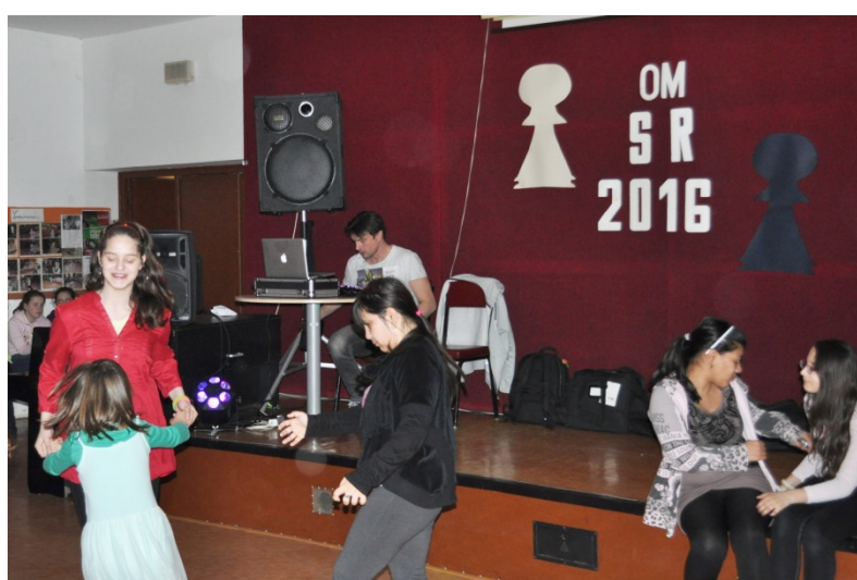
Šachový turnaj, Základná škola pre zrakovo postihnuté deti, Svrčia 6, rok 2016