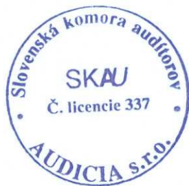
Zodpovedný audítor: Ing. Adrian KIRCHNER Licencia SKAU č. 902

AUDICIA s.r.o. Nad ostrovom 4 841 04 Bratislava Licencia SKAU č. 337