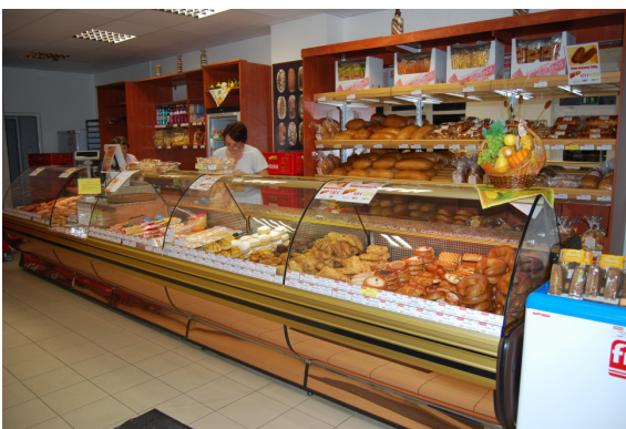
Predajne v Senci

Spoločnosť ku koncu roka 2015 mala vybudovaných 11 podnikových predajní, ktoré sa nachádzajú v Bratislavskom a Trnavskom kraji.