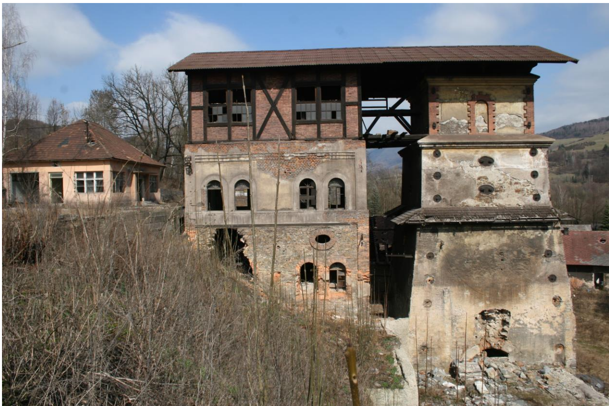
Obrázok 2. – Vysoká pec „Etelka“

V roku 2016 vykonala Nezisková organizácia Barbora v spolupráci s Fakultou architektúry Slovenskej technickej univerzity v Bratislave štúdiu využiteľnosti areálu a pripravila zámer obnovy vysokej pece so zreteľom na zabezpečovacie práce a statické zabezpečenie objektu. S ohľadom na súčasný stav pamiatky a potrebu urýchleného vykonania zabezpečovacích a statických prác, podala Nezisková organizácia Barbora v decembri roku 2016 žiadosť o poskytnutie dotácie z rozpočtovej kapitoly Ministerstva kultúry Slovenskej republiky v programe Obnovme si svoj dom na rok 2017.