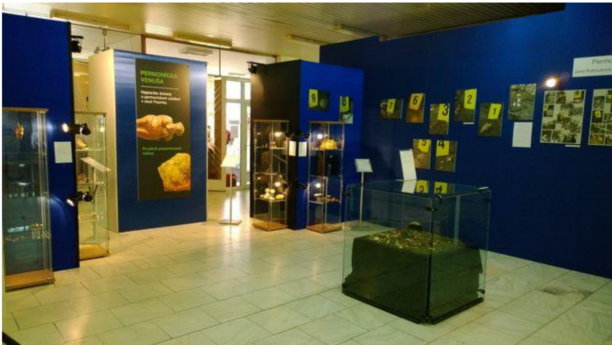
Obrázok 3. – Kultúrne podujatie „Pezinský Permoník 2016“

Pezinský Permoník je podujatím, ktoré vďaka medzinárodnej návštevnosti presahuje pôsobnosť regiónu. Umožňuje výmenu zberateľských skúseností domácich aj zahraničných vystavovateľov, ponúka návštevníkom možnosť kultúrneho vyžitia a nadobudnutia nových poznatkov o geologických a mineralogických fenoménoch Malých Karpát, ale aj iných častí Slovenska a okolitých krajín, ktoré sú obsiahnuté v zaujímavých fotografických, ale aj archeologických či geologických výstavách. Sprievodný program podujatia je tvorený už tradičnými ukážkami techník ryžovania zlata, hudobným programom v podobe koncertných vystúpení, detskou súťažou v maľovaní Permoníka, mestskou opekačkou a tancovačkou. Cieľom celovíkendového podujatia Pezinský Permoník je popularizácia geovedy, zachovanie baníckej tradície a propagácia vzácnych prírodných fenoménov regiónu formou tvorby kultúrneho podujatia.