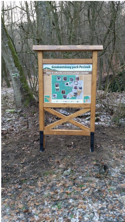
Obrázok 1. – Informačné lokality na štôlni Budúcnosť a Limbašskej vyvieracke.

geoparku. Vďaka finančnej podpore Bratislavského samosprávneho kraja vo výške 4.000 € boli na propagáciu územia geoparku vytvorené dve informačné lokality s informačnými tabuľkami a oddychovou zónou.