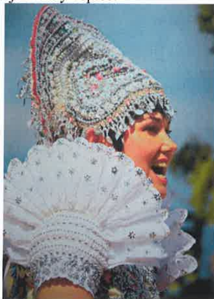
Obr.č.2 Súčasný odev – žena v rohatom čepci

Ľudový odev bol typicky tekovský, ale sviatočný kroj bol bohato zdobený. Najzaujímavejšou časťou kroja je rohatý čepiec.