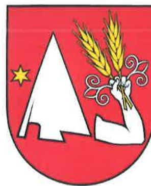
Obr.č.5 Vlajka, pečať, erb

Heraldická komisia Ministerstva vnútra Slovenskej republiky prerokovala návrh erbu obce Podlužany a odporučila ho na prijatie obecným zastupiteľstvom a na zaevidovanie do Heraldického registra SR v tejto podobe: