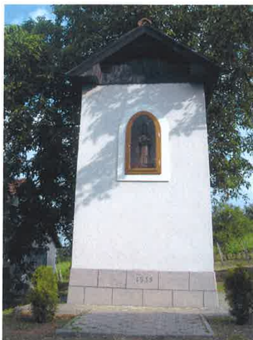
Obr.č.4 Kaplnka sv. Urbana na Viničkách

Z kultúrnych pamiatok hodno spomenúť Kaplnku so sochou sv. Urbana – patróna viníc, ktorá bola postavená pred vyše 100 rokmi najprv v drevenej podobe a potom pred vojnou v murovanej podobe. Obec ju v roku 1999 zrekonštruovala, keď bola posvätená, obec vydala svoju prvú pohľadnicu. Socha sv. Urbana je symbolom tradície vinohradníctva v obci.