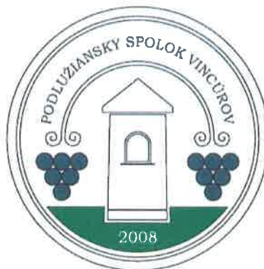
Logo Podlužianskeho spolku vincúrov