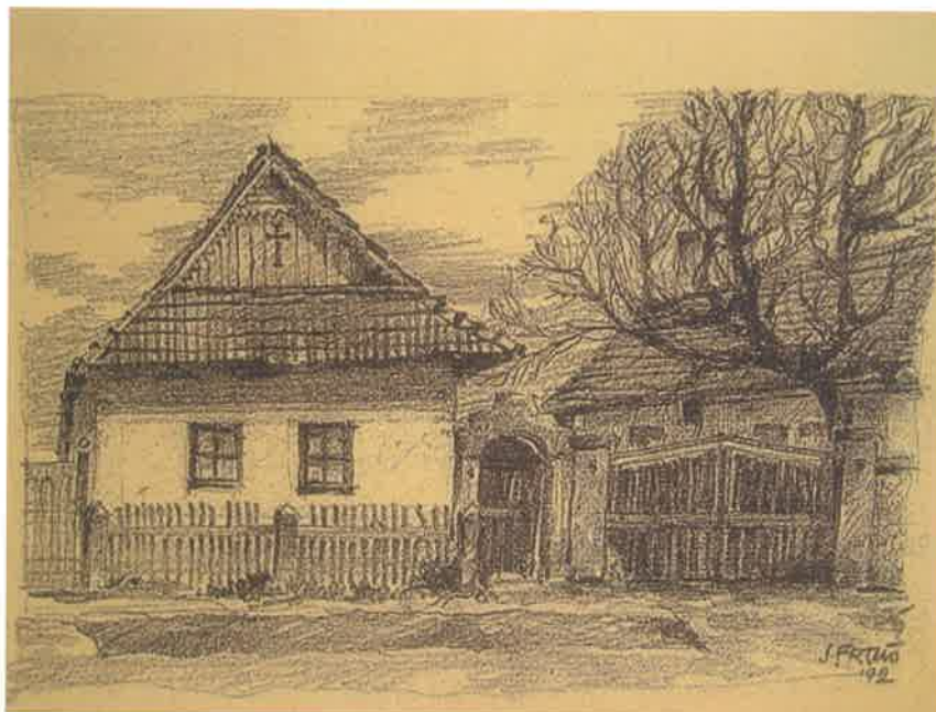
Obr.č.1 Ľudová architektúra – rodinný dom č. 132 – richtárov (zbúraný v roku 1999)

Obyvateľstvo je rímsko-katolíckeho vyznania, v celej histórii výlučne národnosti slovenskej. Obec z hľadiska zástavby bola typickou obcou tekovskej župy, keď domy boli murované z hliny alebo kameňa so sedlovou strechou. Vstup do pitvora bol zdôraznený výpusťkom. Dvory boli uzavreté bránou, bráničkou s kamenným ostením. Zo strany dvora boli stĺpové podstrešia.