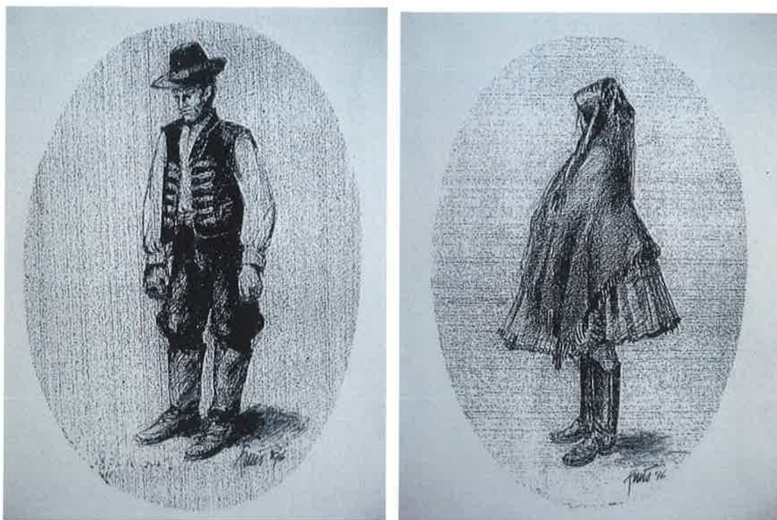
Obr.č.3 Tekovský ľudový odev – kresba Ing. arch. Jozefa Frtúsa, rodáka z Podlužian, čestného občana obce

Z kultúrnych pamiatok hodno spomenúť Kaplnku so sochou sv. Urbana – patróna viníc, ktorá bola postavená pred vyše 100 rokmi najprv v drevenej podobe a potom pred vojnou v murovanej podobe. Obec ju v roku 1999 zrekonštruovala, keď bola posvätená, obec vydala svoju prvú pohľadnicu. Socha sv. Urbana je symbolom tradície vinohradníctva v obci.