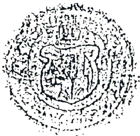
Pečať Machuliniec z 18. stor.

Z úcty k vlastnej histórii obce je najvýhodnejšie pečatný symbol využiť aj pre tvorbu nového erbu obce. Je však ho potrebné vhodne hierarchicky štylizovať a farebne zladiť. Symbol lemeša, čeriesla a klasu treba považovať za významovo hlboký. Nemožno sa uspokojiť len s konštatovaním, že ide o poľnohospodársky motív.