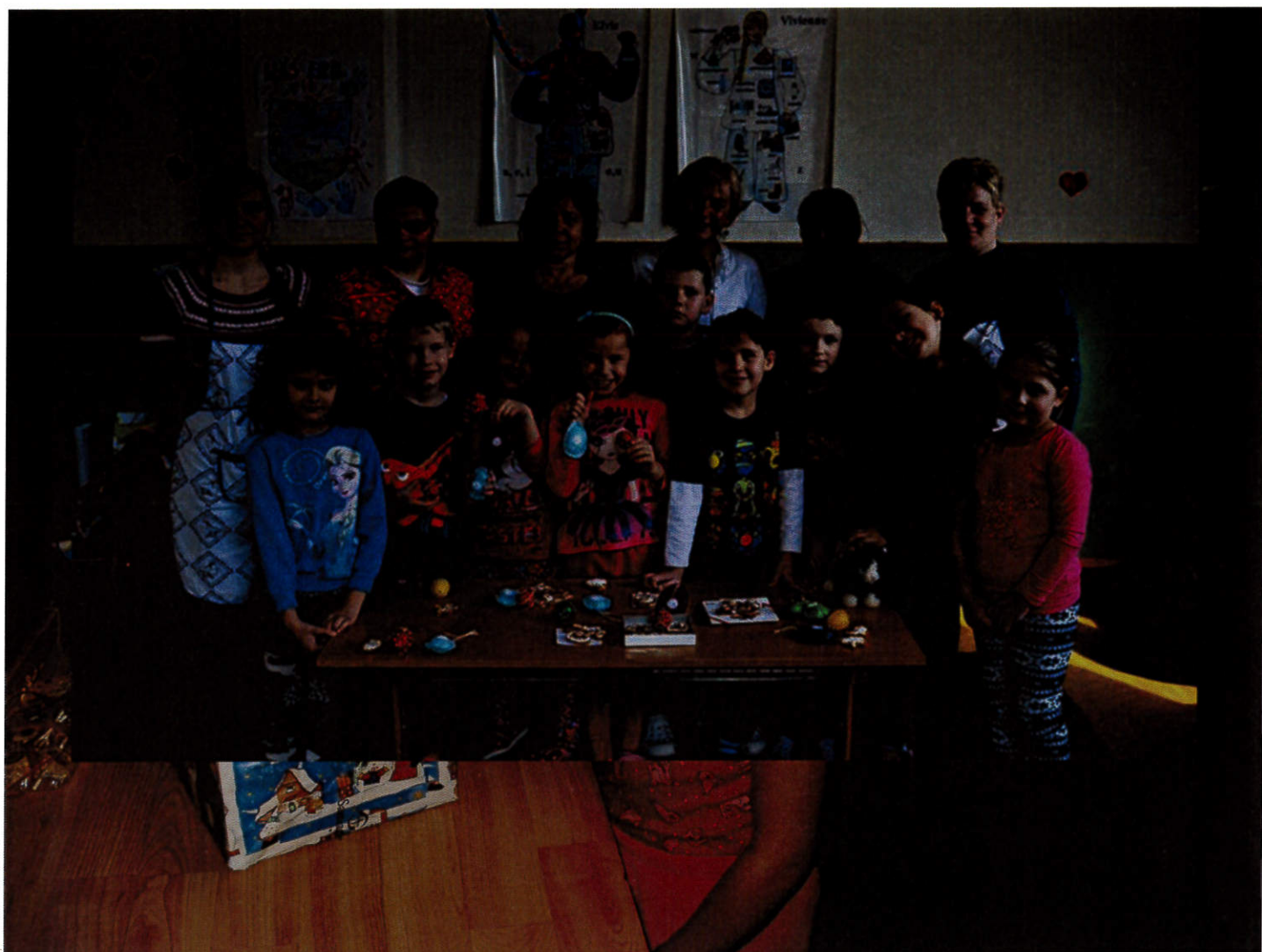
Jarný tábor 4. marec 2016, Rimavská Sobota