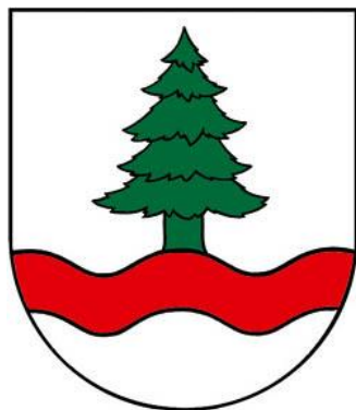
obr. Erb obce Červená Voda

Pečať obce je okrúhla, uprostred so symbolom obce a kruhopisom OBEC ČERVENÁ VODA.