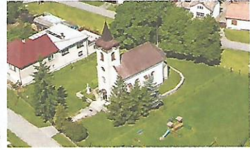
-Rímskokatolícky secesný kostol sv. Ladislava z r. 1899