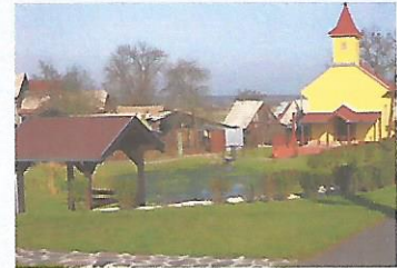
-Kostol kráľa sv. Ružena z r. 1935 vo Fil. Kľačanoch