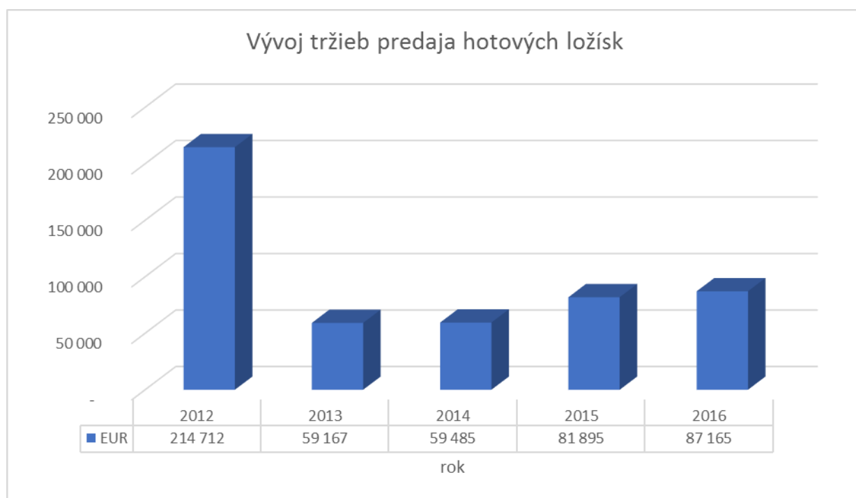
Obr. č. 2 Vývoj tržieb hotových ložísk spoločnosti ZVL-TSB s. r. o.

Aký vývoj nastal v oblasti hotových ložísk ZVL-TSB ukazuje nasledujúci graf.