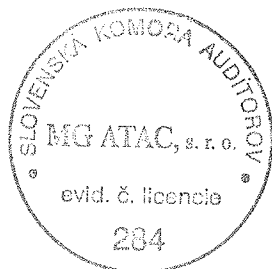
Kľúčový štatutárny audítor: Ing. Miroslav Galamboš Licencia SKAU č. 502

Audítorská spoločnosť: MG ATAC, spol. s r. o. Krškanská 21, Nitra Licencia SKAU č. 284