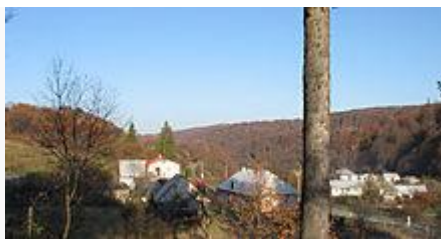
Vzadu na horizonte vrch Čerešňa