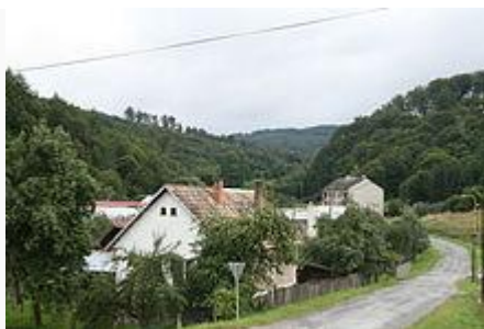
Údolie Prikrianky s chránennou krajinou oblasťou Východné Karpaty