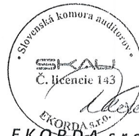
E K O R D A, s.r.o. Révová 45, Bratislava Licencia SKAU 143