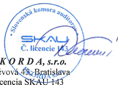
E K O R D A, s.r.o. Révová 45, Bratislava Licencia SKAU 143