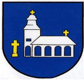
Erb obce :