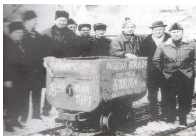
Posledný vagón s rudou vyvezený z bane