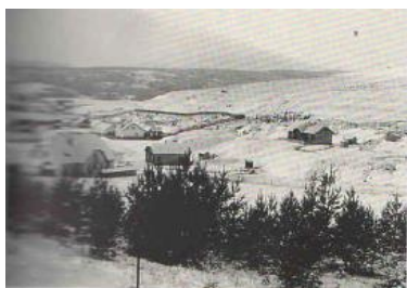
Areál manganorudných baní v Kišovciach

Mangánová ruda ako strategická surovina pre výrobu ocelí začala byť vyhľadávaná v druhej polovici 19. storočia, v období industriálnej revolúcie v Uhorsku. V roku 1939 sa zvýšila ťažba mangánovej rudy, čo malo za následok príliv prisťahovalcov za prácou nielen z rôznych častí Slovenska, ale aj Maďarska, Poľska i Rumunska. Na začiatku 20. storočia sa vyčerpala povrchovo dobývateľná časť ložiska a prešlo sa na otváranie hlbinných častí. To si vyžadovalo investičné prostriedky a modernejšie technické vybavenie bane. Vítkovicke banské a hutné ťažiarstvo Kotterbachy vystavali banský závod s bytovou kolóniou a lanovkou ku železnici v Kišovciach. Banská a hutná spoločnosť zasa postavila vlastný závod vo Švábociach. V roku 1941 – 1945 bane získala Ruda, uč. Spol. Koterbachy. V roku 1945 bola tunajšia baňa znárodnená a stala sa závodom Železorudných baní Spišská Nová Ves. Ťažba bola ukončená 1. apríla 1971 z ekonomických dôvodov.