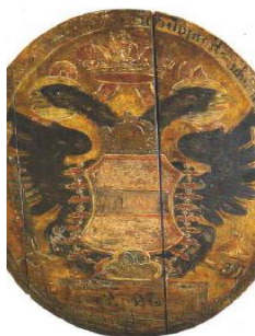
Vývesný štít pošty v Hôrke

Vo Svätom Ondreji v rokoch 1850- 1854 mal sídlo a fungoval okresný súd. V 13. storočí tu bol postavený kostol, ktorý bol v 18. storočí prestavaný. Obec preslávili aj minerálne pramene, ktoré vplyvom banskej činnosti sa skoro všetky v 50. rokoch stratili.