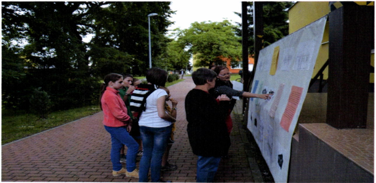
Víkend otevřených parků a záhrad