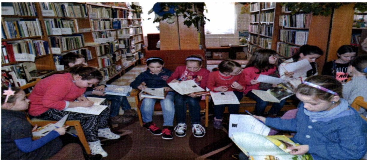
Deň ľudovej rozprávky 2016

Medzi obľúbené podujatia v mesiaci marec patrí Deň ľudovej rozprávky, ktorého sa zúčastnilo 27 detí.