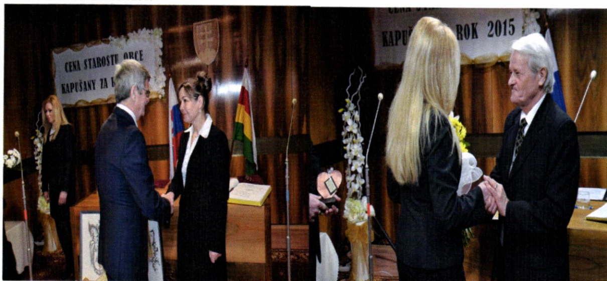
Cena starostu obce za rok 2015

Každoročné počas fašiangového obdobia sa konala obecná zabíjačka spojená s ochutnávkou zabíjačkových jedál.