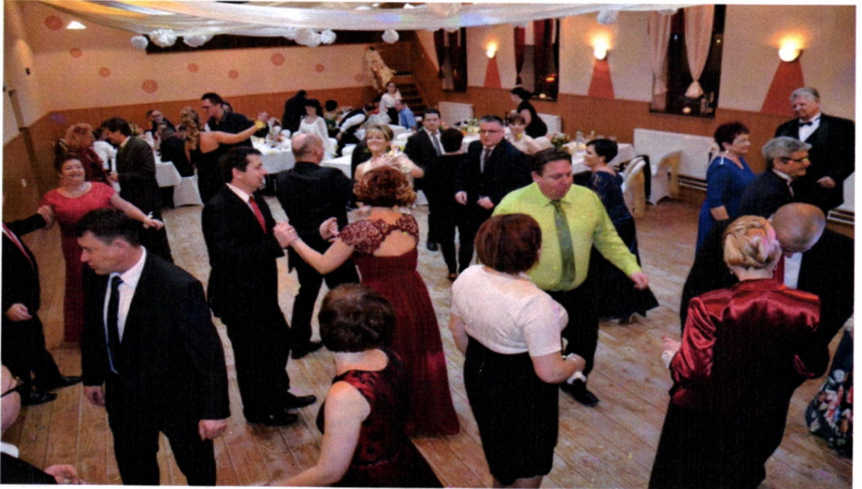
Reprezentačný ples obce Kapušany a Rady rodičov pri ZŠ s MŠ

23. januára sa konalo v sobášnej sieni obecného úradu udelenie Ceny starostu obce za rok 2015 z potreby morálneho poďakovania občanom, ktorí sa pričínili o rozvoj územia obce, reprezentovali ju alebo ju v pozitívnom zmysle nejakým zásadným spôsobom ovplyvnili.