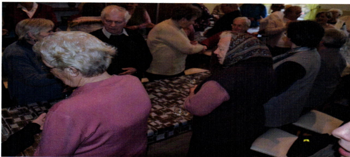
Otvorenie denného stacionára