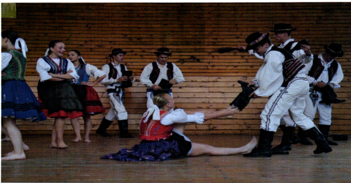
Kapušianske folklórne dní 2016- Vystúpenie FS Kapušančan

Dňa 11.1.2016 bol slávnostne otvorený denný stacionár v budove bývalej materskej školy, prevádzkovateľom ktorého je Atrium n.o.