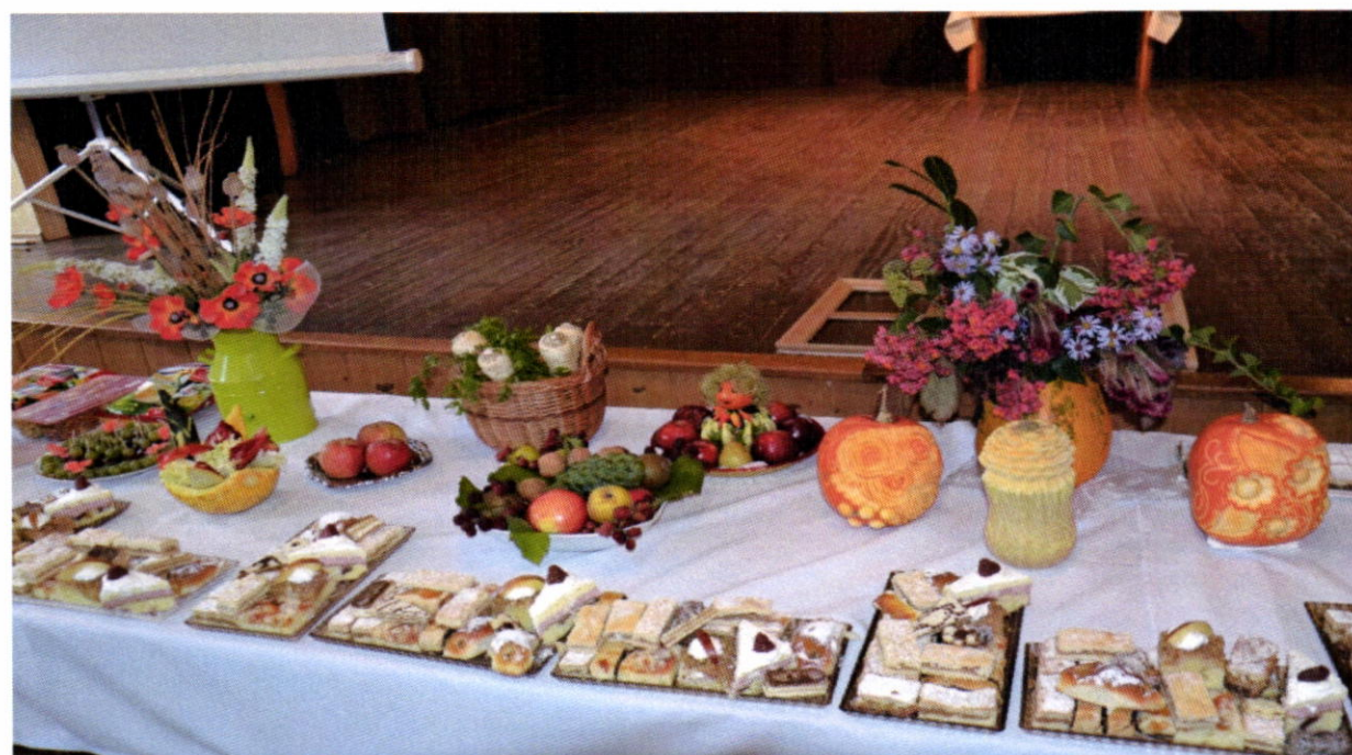
Jesenné jablkové hodovanie