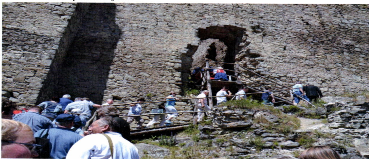
Otvorenie vyhliadkovej veže na hrade Kapušany 2016

18. júna po svätej omši na nádvorí hradu bola slávnostne prestrihnutá páska na správcovskom objekte- infocentre hradu a vyhliadkovej veži.