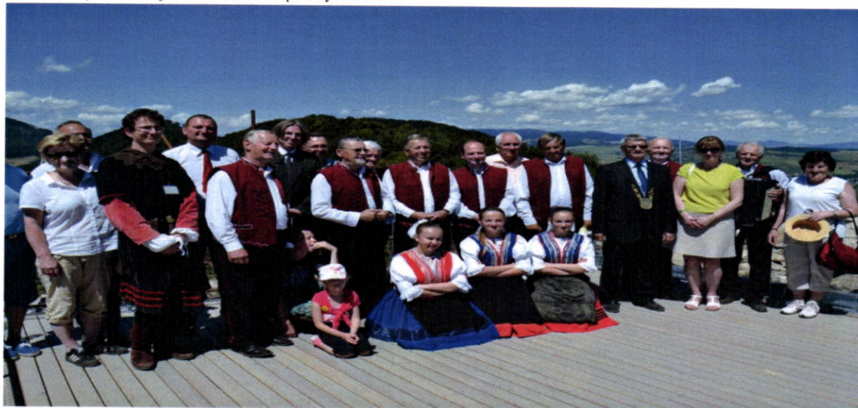
Otvorenie vyhliadkovej veže na hrade Kapušany 2016