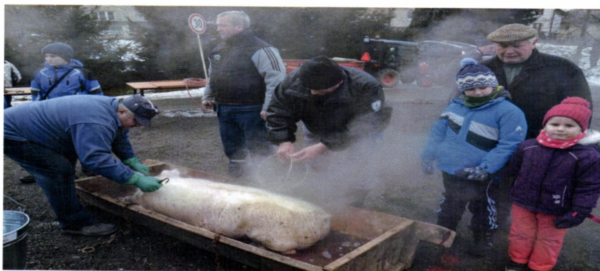
Obecná zabíjačka v roku 2016

Každoročné počas fašiangového obdobia sa konala obecná zabíjačka spojená s ochutnávkou zabíjačkových jedál.