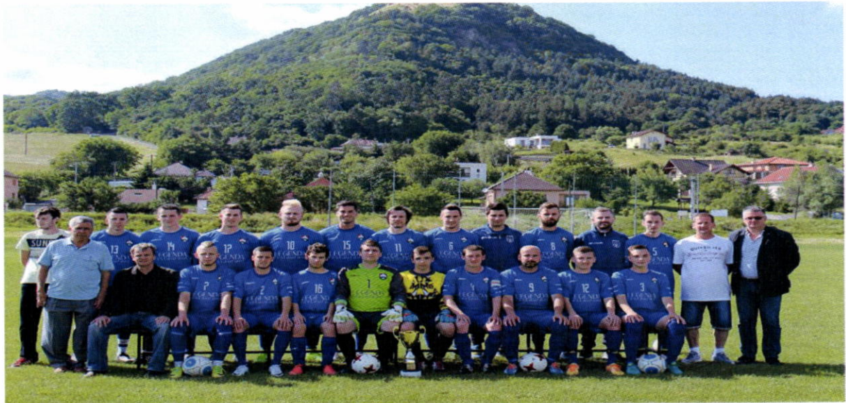
A mužstvo OŠK Kapušany