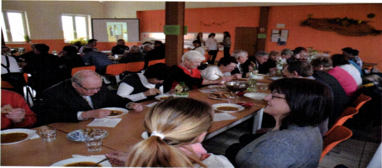
Pôstna polievka v roku 2016

V marci obec zorganizovala podujatie Pôstna polievka, z ktorej výťažok bol určený do domov sociálnych služieb, v ktorých sú umiestnení naši občania. Výnos z pôstnej polievky bol odovzdaný Integrovanému zariadeniu KOR –GYM, n.o. Hertník v sume 300,- € a zariadeniu pre seniorov Náruč, Prešov v sume 250 €.