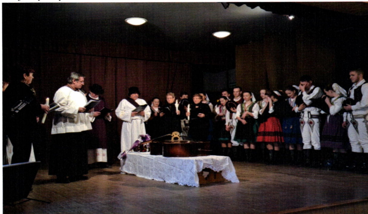
Fašiangový sprievod s pochovávaním basy v roku 2016

Klub seniorov každý rok usporadúva fašiangový sprievod spojený s dramatickým pásmom tzv. „Pochovávanie basy“, ktorým končí obdobie zábavy a nastáva čas pôstu. Členovia klubu pripravujú aj slávnostné podujatie Jesenné jablkové hodovanie a organizujú poznávacie zájazdy a návštevy kultúrnych inštitúcií . Taktiež zapájajú sa aj do prác prospešných pre obec a to upratovania Domu nádeje a výsadby kvetov na Námestí sv. Martina.