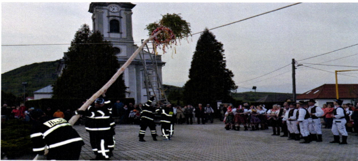
Stavanie mája pred kostolom sv. Martina

Počas letných mesiacov obec pripravila viaceré kultúrne podujatia v rámci Kapušianskeho kultúrneho leta . Stavanie mája pred kostolom sv. Martina spojené so zapálením vatry v parku svätých Cyrila a Metoda, Deň detí spojené so súťažou Kapušany majú talent, Deň matiek, Víkend otvorených parkov a záhrad spojený s Dňom otcov, dvojdňové podujatie Návrat do stredoveku.