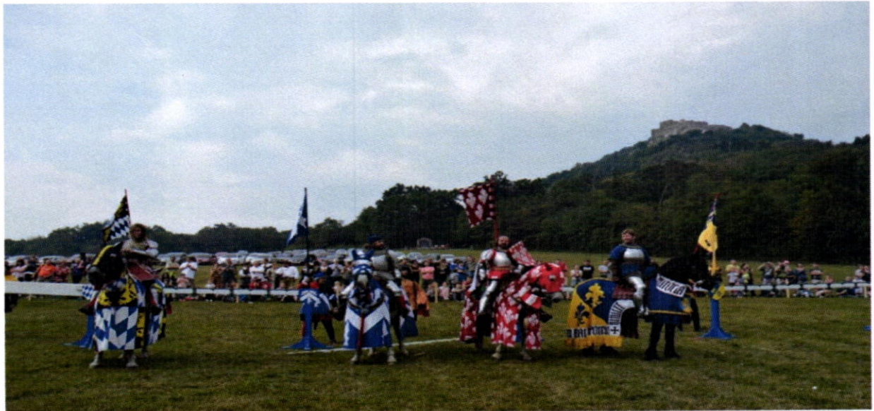
Návrat do stredoveku - podujatie pod hradom