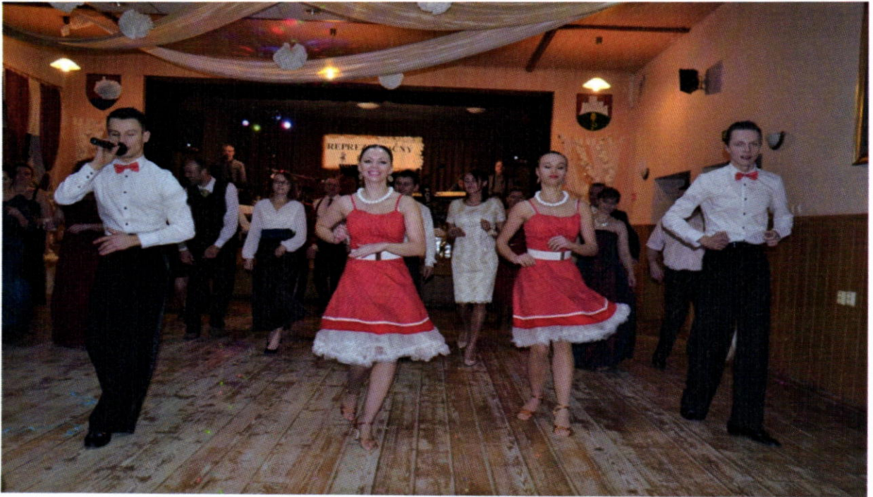
Reprezentačný ples obce Kapušany a Rady rodičov pri ZŠ s MŠ

16. januára sa konal reprezentačný ples, ktorého organizátorom bol obecný úrad spolu s členmi Rady rodičov pri ZŠ s MŠ.