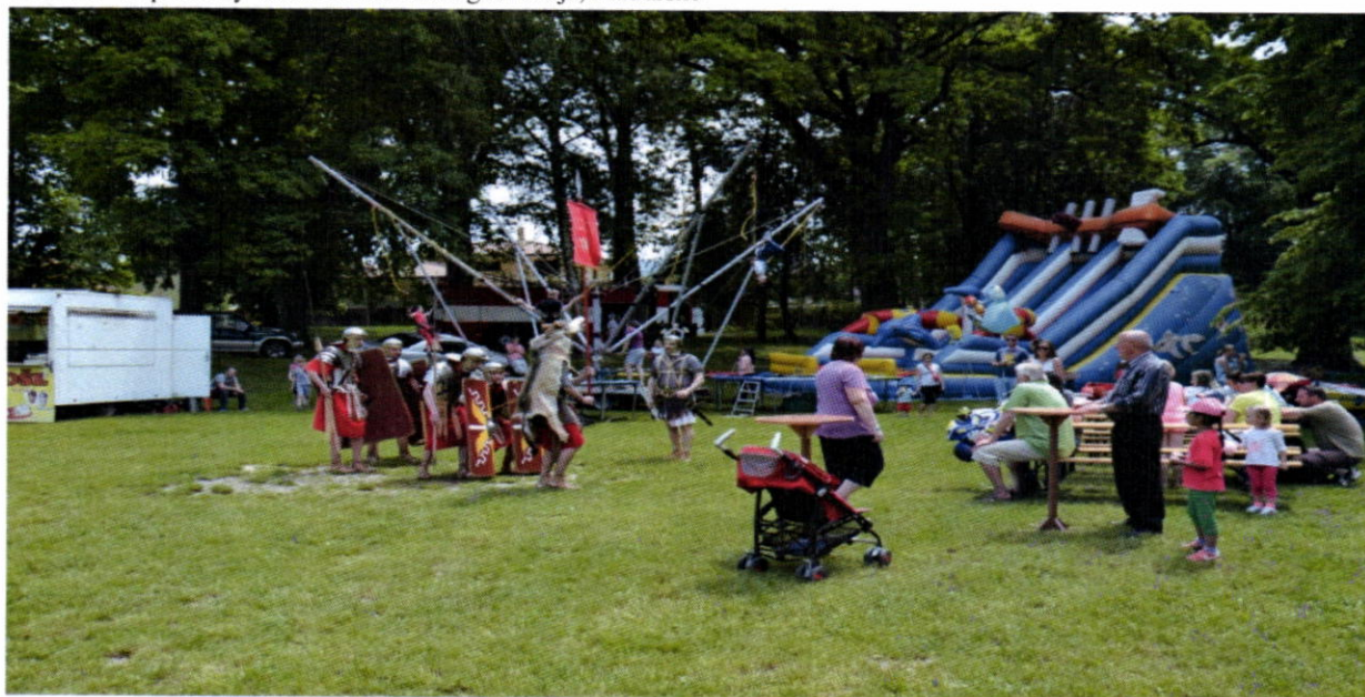
Deň detí – predstavenia a súťaže