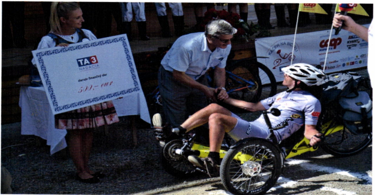
Káčer na bicykli 2016 – koniec 5. etapy Kapušany