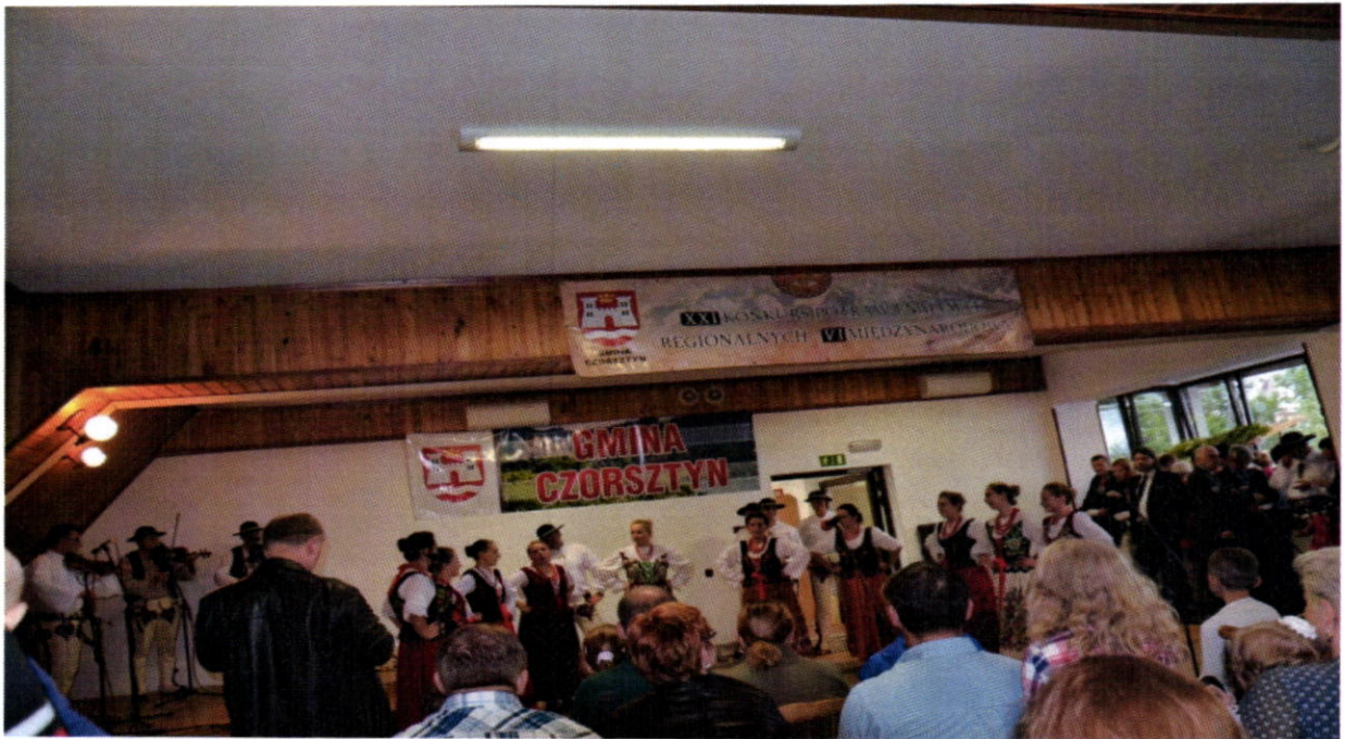
Sút'áž tradičných jedál gmina Czorsztyń- folk. výstupenie