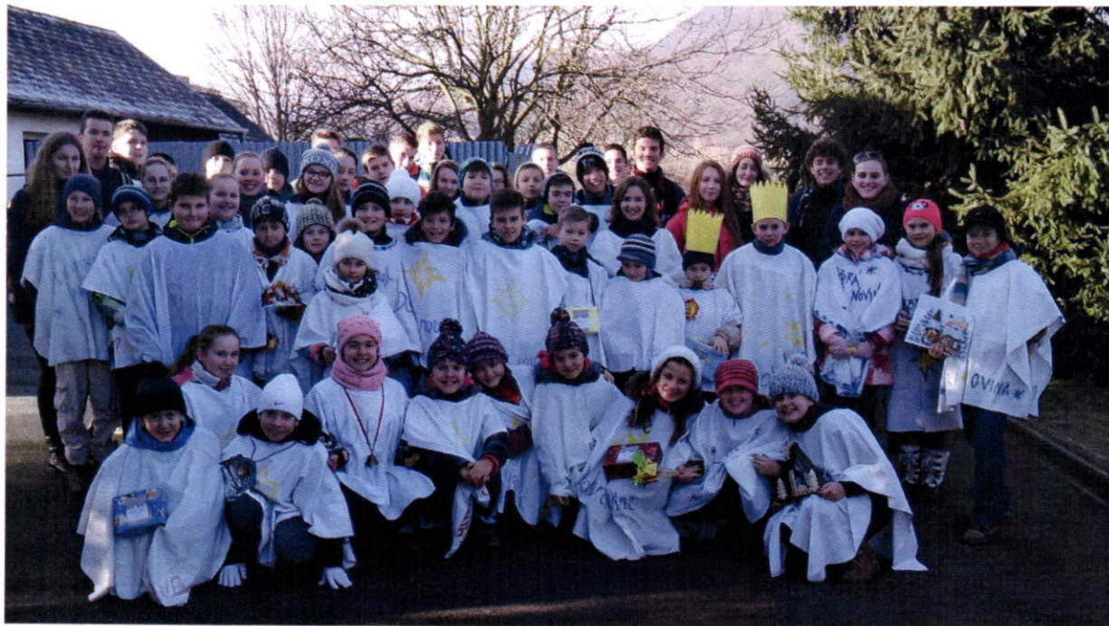
Koledníci dobrej noviny

Počas Vianočných sviatkov kapušianske deti a mládež chodievajú po koledovaní v rámci koledníckej akcie s názvom Dobrá novina , ktorá je spojená so zbierkou pre projekty rozvojovej spolupráce v afrických krajinách a zároveň programom rozvojového vzdelávania počas celého roka.