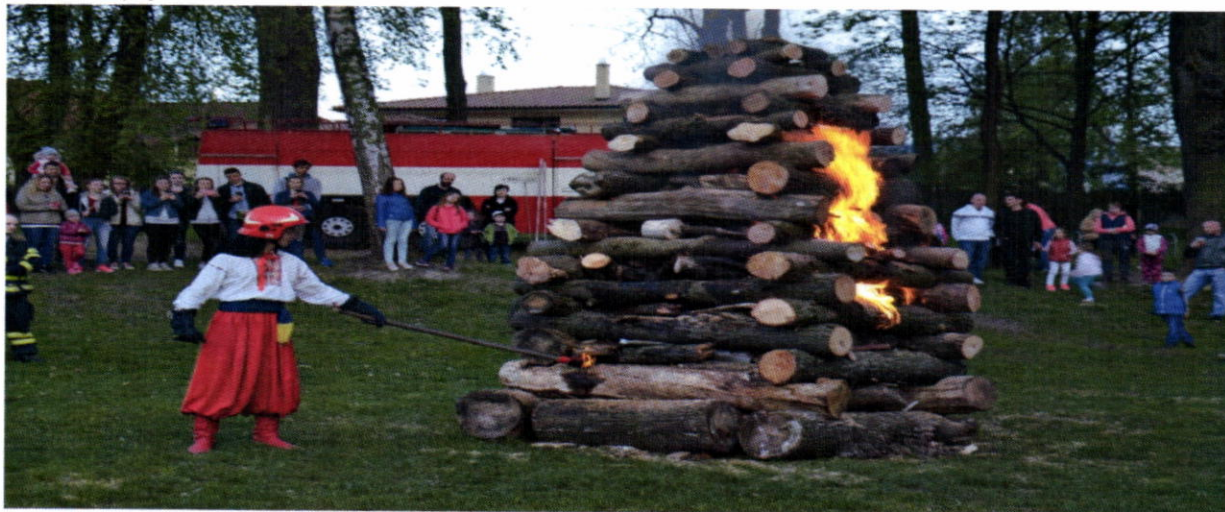
Zapálenie vatry v parku svätých Cyrila a Metoda