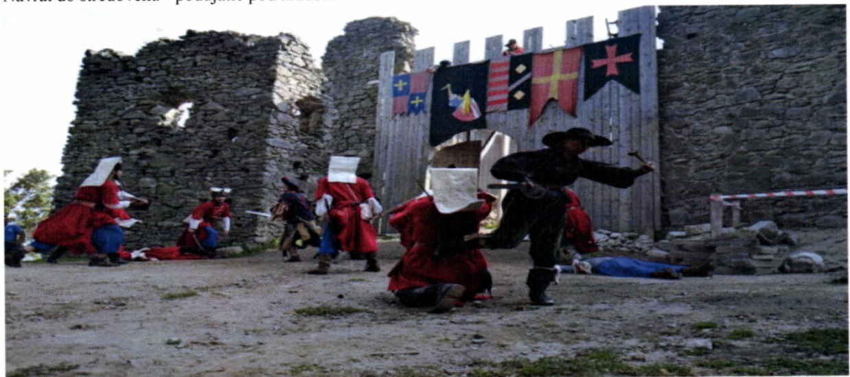
Návrat do stredoveku- dobýjanie hradu

Pri príležitosti sviatku sv. Mikuláša obec pripravuje stretnutie detí pri kultúrnom programe spojené s darovaním darčiekov.