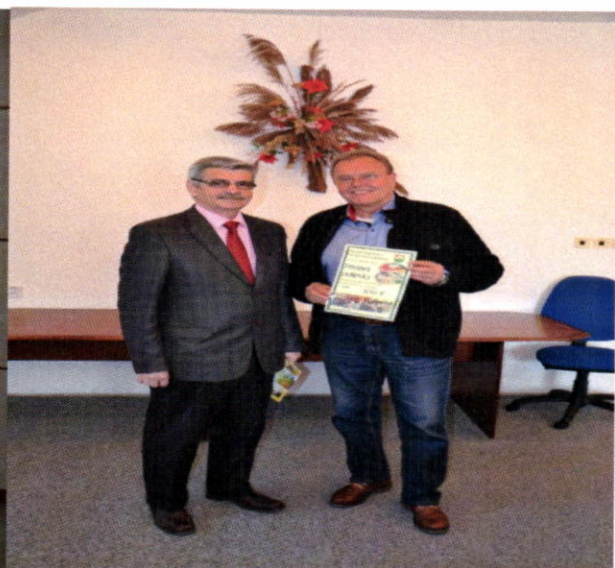
Odovzдание vyzbieranej sumy z Pôstnej polievky v roku 2016