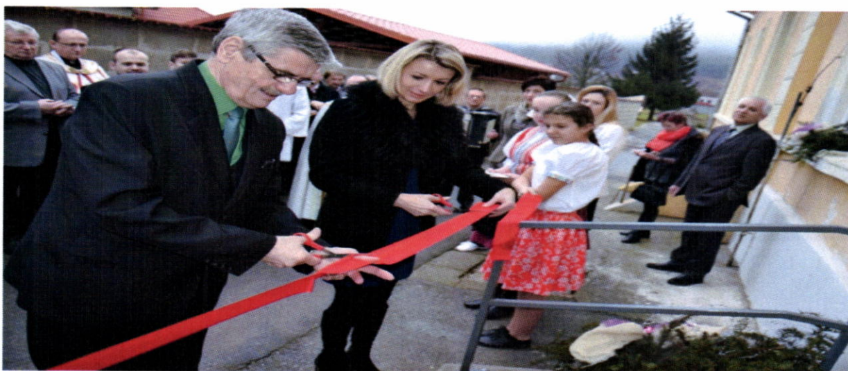
Otvorenie denného stacionára

Dňa 11.1.2016 bol slávnostne otvorený denný stacionár v budove bývalej materskej školy, prevádzkovateľom ktorého je Atrium n.o.