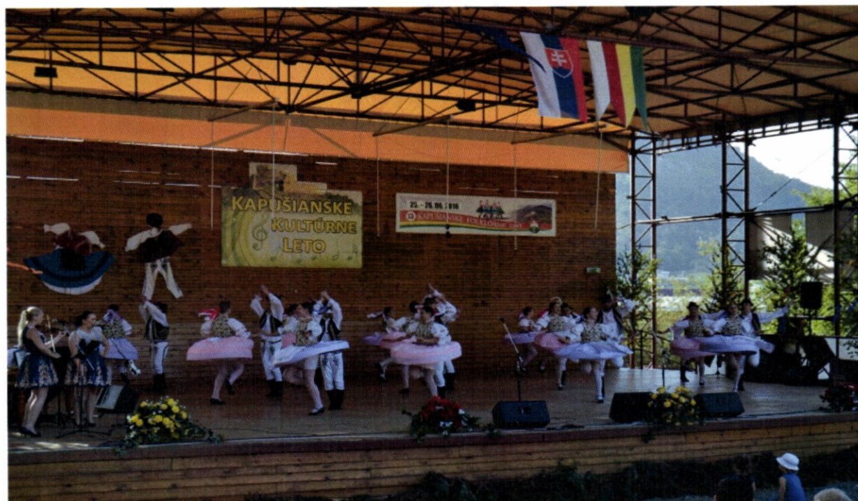
Kapušíanske folklórne dni 2016- Vystúpenie FS Vargovčan