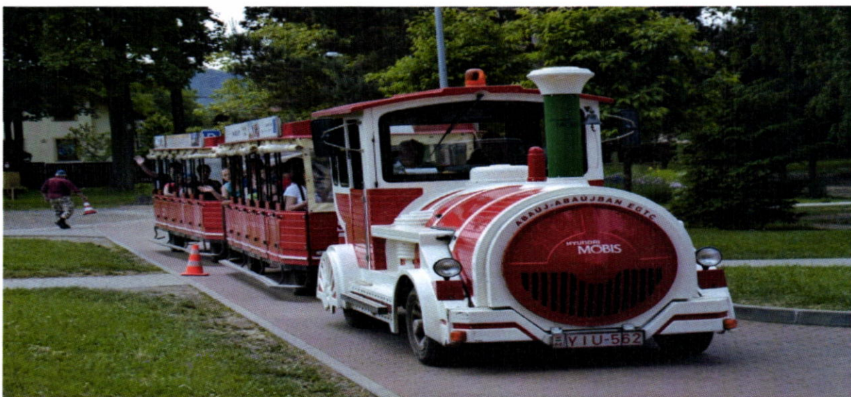
Deň detí – zapožičaný vláčik z obce Boldogkövartalja, Maďarsko