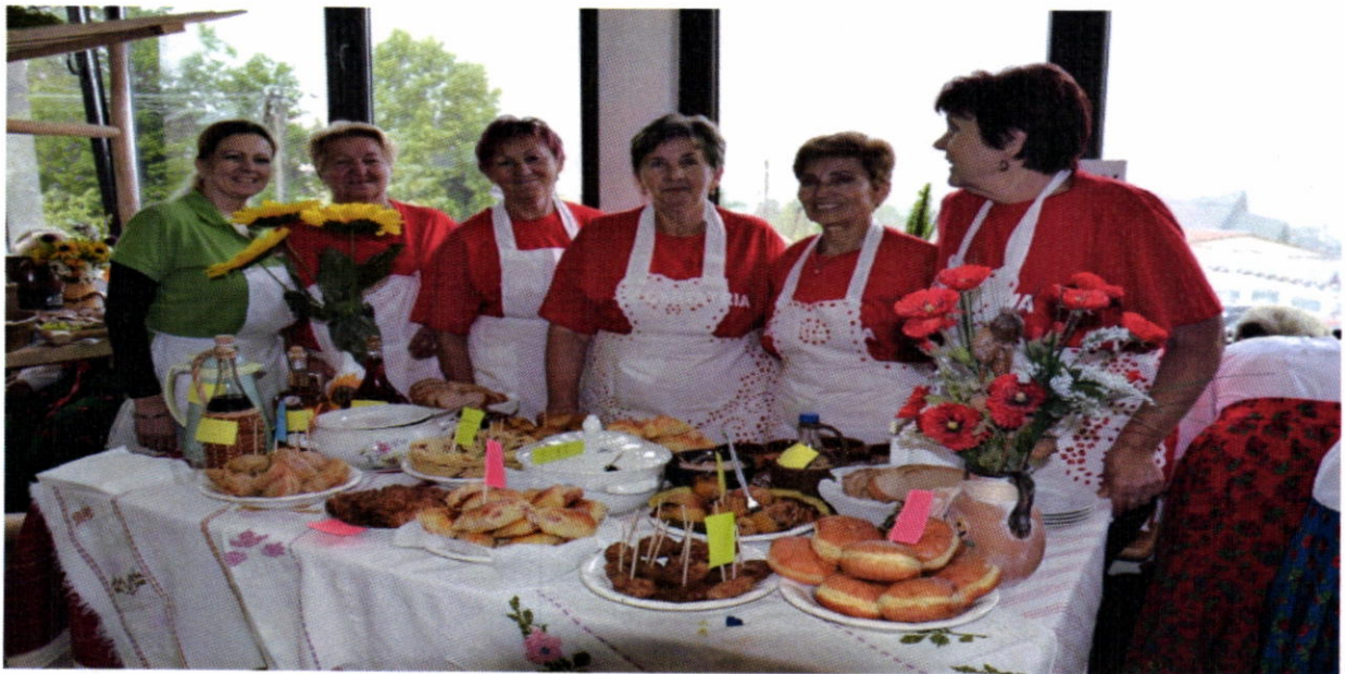
Sút'áž tradičných jedál gmina Czorsztyń