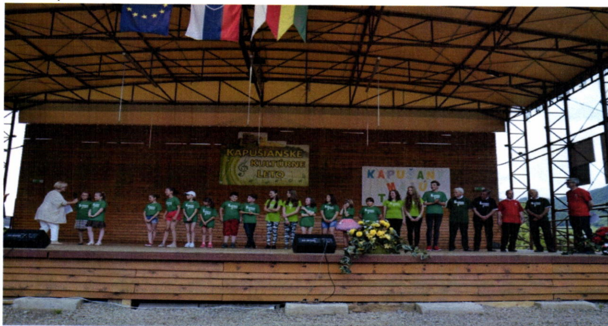
Kapušany majú talent