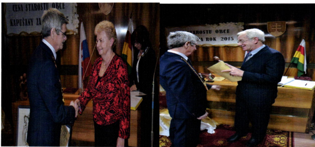
Cena starostu obce za rok 2015