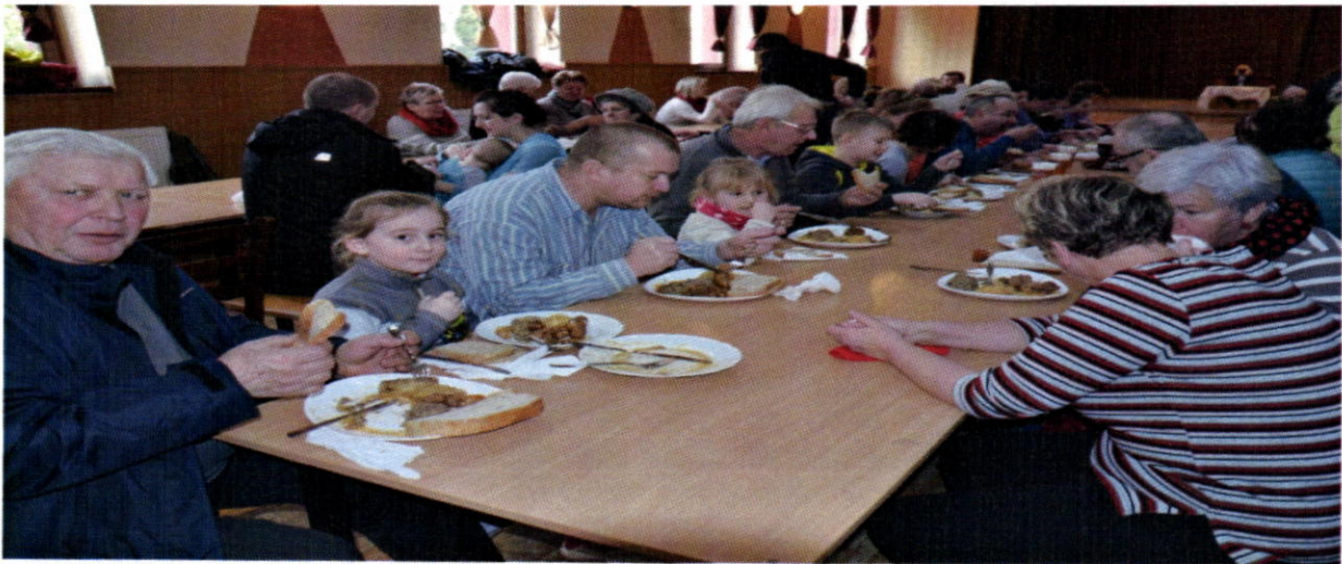
Obecná zabíjačka v roku 2016

V marci obec zorganizovala podujatie Pôstna polievka, z ktorej výťažok bol určený do domov sociálnych služieb, v ktorých sú umiestnení naši občania. Výnos z pôstnej polievky bol odovzdaný Integrovanému zariadeniu KOR –GYM, n.o. Hertník v sume 300,- € a zariadeniu pre seniorov Náruč, Prešov v sume 250 €.