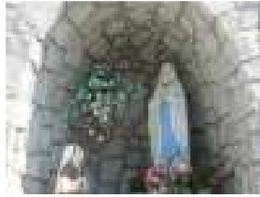
Jaskyňa Lurdskej Panny Márie