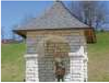
Kaplnka sv. Floriána