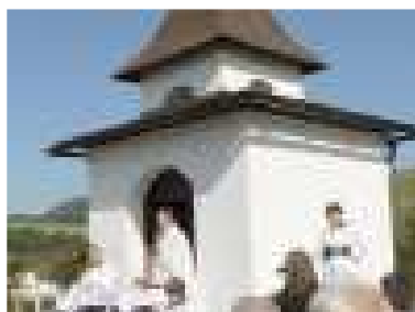
Kaplnka Nanebovzatia P. Márie