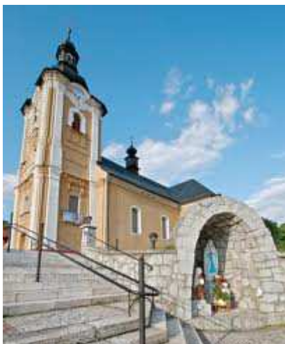
Kostol svätého Andreja