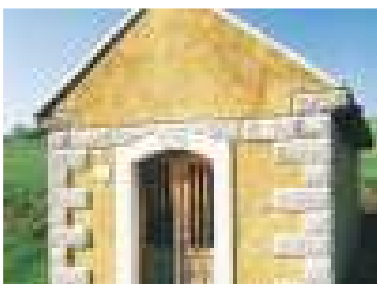
Kaplnka Sedembolestnej P. Márie