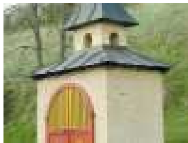
Kaplnka sv. Barbory