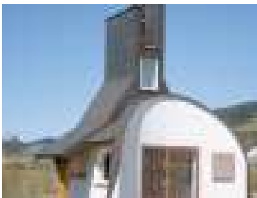
Kaplnka sv. Jána Nepomuckého