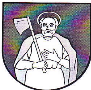
Obr. č. 2: Erb obce Tvarožná

Svätý Matej apoštol je patrónom farského rímskokatolíckeho kostola.