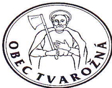
OBR. Č. 4: PEČAŤ OBCE TVAROŽNÁ

V pečati sa vyskytuje horná časť postavy svätého Mateja odetého v plášti, s gloriolou okolo hlavy, ako drží v pravej ruke sekeru opretú o plece.