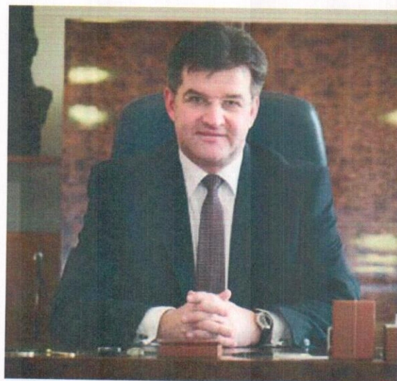
JUDr. Miroslav Lajčák Minister zahraničných vecí a európskych záležitostí Slovenskej republiky