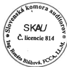
Renáta Bláhová Zodpovedný audítor Licencia SKAU č. 814