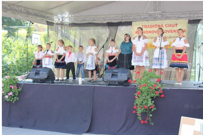
Obrázok 7 Vystúpenie detí na TCHH 2016