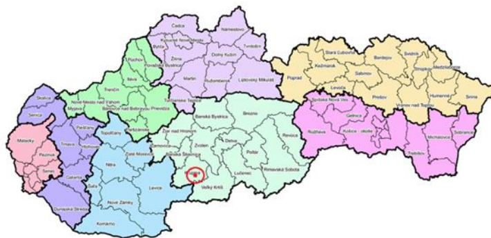
Obrázok 1 Geografická poloha obce