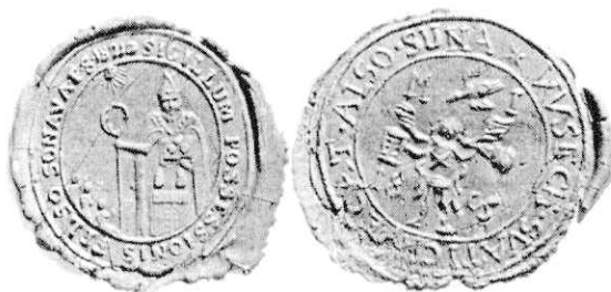
Obecné pečate z 19.storočia