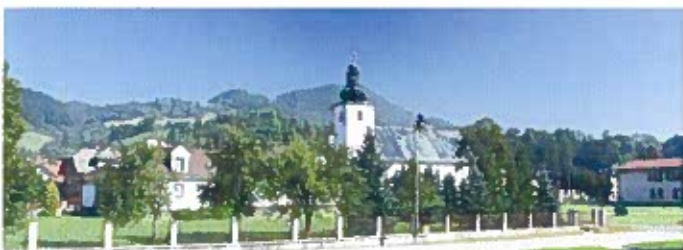
Kostol sv. Ladislava,