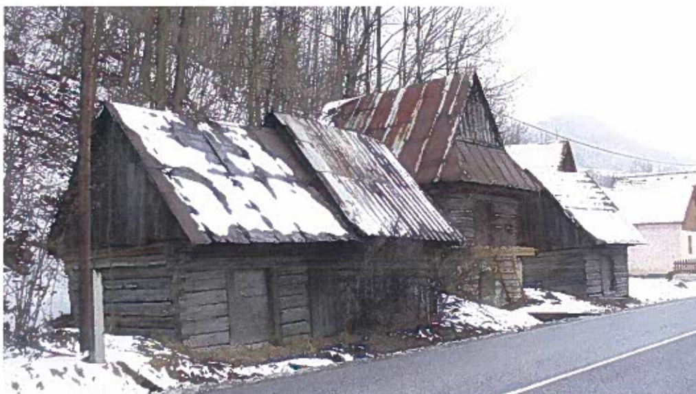
zrubové sýpky – sypárne.