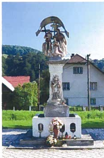
Kamenný stĺp so súsoším Korunovania Panny Márie,