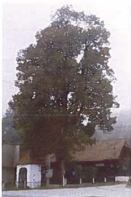
chránený strom – lipa veľkolistá,