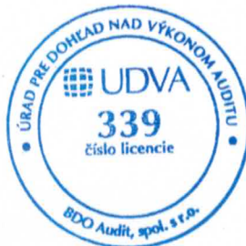
BDO Audit, spol. s r. o. Licencia UDVA č. 339

28. februára 2017 Zochova 6-8 Bratislava, Slovenská republika