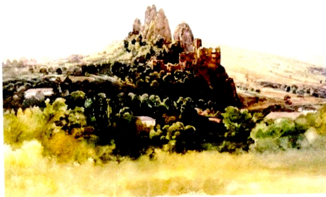
Hrad v obci Lednica

Lednica ako kráľovské mesto, ktorým sa stalo v 15. storočí, bolo súčasne z miestnym hradom obrannou výspou, na hraniciach Uhorska. Hrad je zvláštnym príkladom architektúry. Do vnútornej časti hradu postavenom na strmých bralách sa dá vojsť len cez niekoľko metrov dlhý tunel, vysekaný do skál vo výške 5-6 metrov. Z tohto miesta, k hlavnej bašte, pozorovateľni vedie 80 kamenných schodov. Pod hradom sa nachádza dedina Lednica. Rodina Erdődyovcov vlastnila v Lednici krásny kaštieľ a panský majer. Bibliografia: Fekete Nagy, Kerekes, Kristó, Lovcsányi, Mednyánszky 844, Mednyánszky 1981, Szombathy 1979, Szontagh 1866.