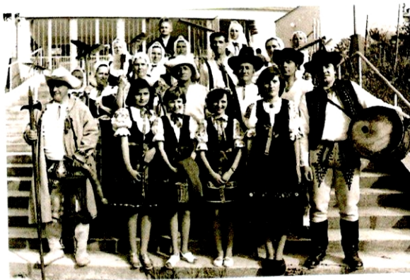
Dožinky-Folklórny súbor Ledničanka

Obec Lednica je známa aj svojim kultúrnym životom. Zachovávajú sa tu tradičné zvyky, napr. Fašiangy, Tri krále či Veľká noc. V spolupráci s folklórnou skupinou sa každoročne usporadúvajú Dožinkové slávnosti spojené s tradičným jarmokom, pripravuje sa pre deti športový deň na Deň detí, Posedenie s dôchodcami, Vianočný koncert v kostole, a pod. Okrem snahy o zachovanie a udržanie starých zvykov sa folklórna skupina úspešne prezentuje aj vystúpeniami na rôznych kultúrnych podujatiach po celom okolí i na blízkej Morave.