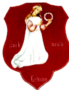
Erb obce Lednica