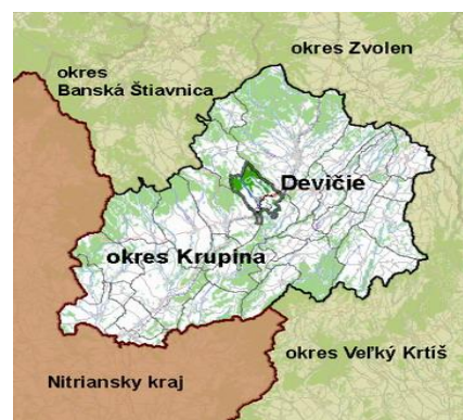
Mapa 1: Geografická poloha obce Devičie

Vzhľadom k tomu, že obec je otvorenou ekonomickou a sociálnou jednotkou s väzbami na svoje okolie je dôležité, kde sa v tomto priestore nachádza.