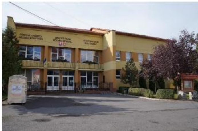
KOSTOL SV. ŠTEFANA KRÁĽA A KULTÚRNY DOM V BISKUPICIACH