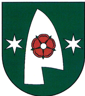
ERB OBCE VEĽKÁ MAČA

Schválené obecným zastupiteľstvom vo Veľkej Mači uznesením č. 52/OZ/14/09/2006.