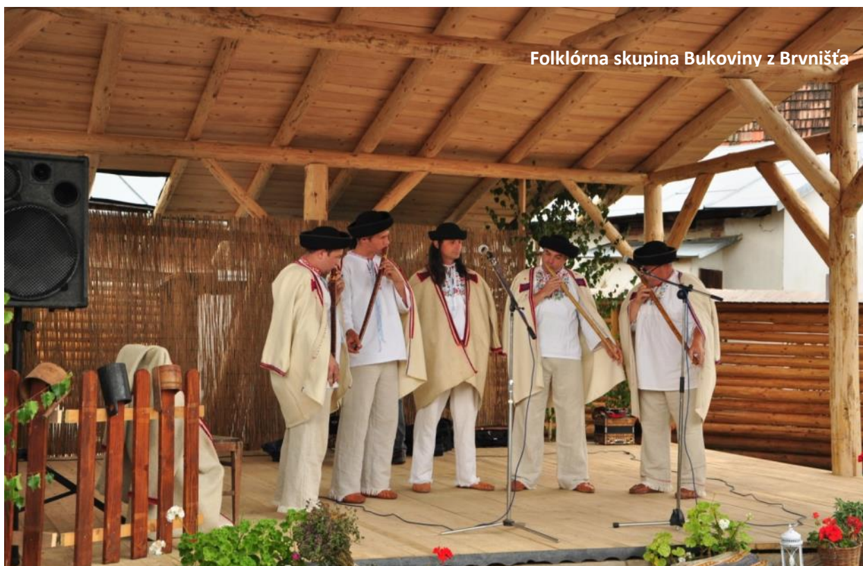
Folklorná skupina Bukoviny z Brvništa