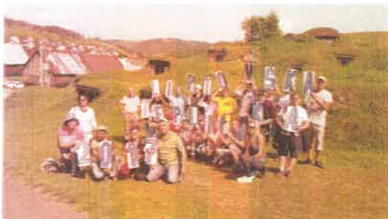
Súťaže po stanovištiach