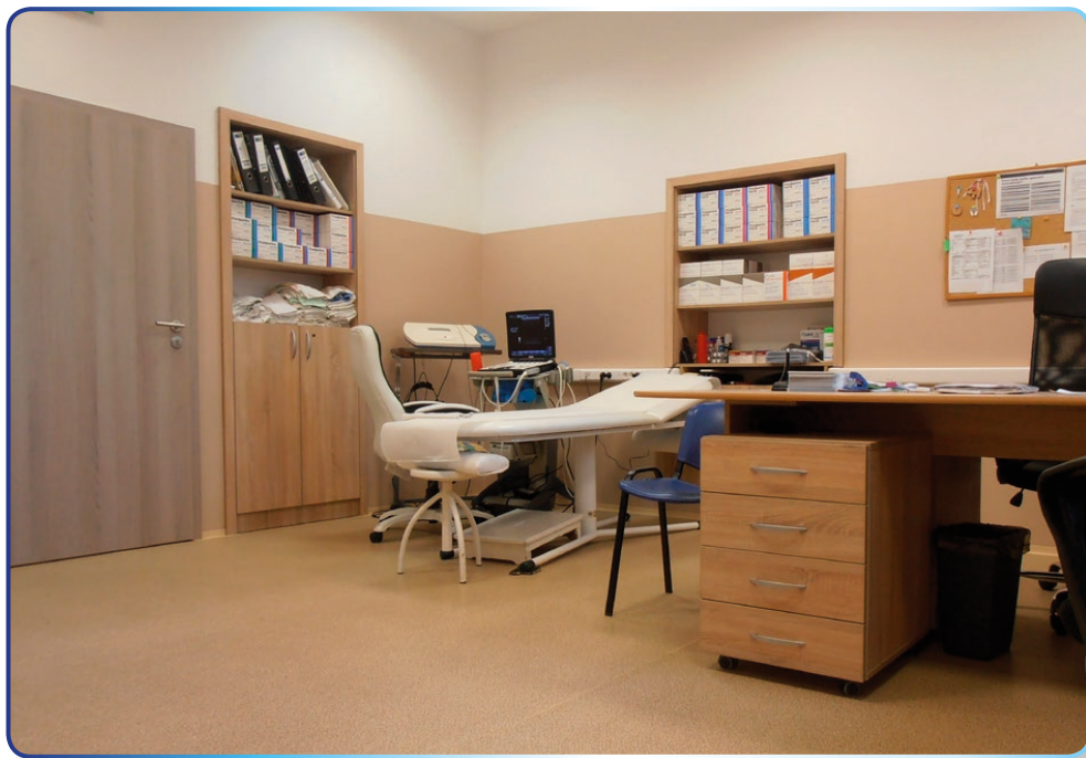
Zrekonštruované priestory cievnej ambulancie

V závere chcem povedať, že všetky pozitívne kroky, ktoré sa podarilo vykonať, by neboli možné bez plnej podpory vedenia spoločnosti AGEL SK a.s., za čo im patrí moja veľká vďaka. Za spoluprácu v roku 2017 ďakujem aj členom dozornej rady. Na rozvoji nášho zdravotníckeho zariadenia sa svojou každodennou prácou podieľajú aj naši zamestnanci. Rád by som im na tomto mieste poďakoval za to, že prispievajú k zlepšovaniu dobrého mena nemocnice a podieľajú sa na zvyšovaní dôvery u našich pacientov. Verím, že aj v nasledujúcom roku budeme spoločnou prácou našu nemocnicu smerovať medzi vyhľadávané zdravotnícke zariadenia, poskytujúce kvalitné zdravotnícke služby empatickými zdravotníckymi profesionálmi.