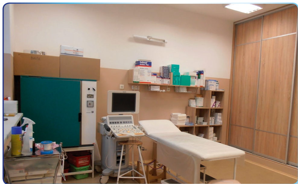
Zrekonštruované priestory cievnej ambulancie