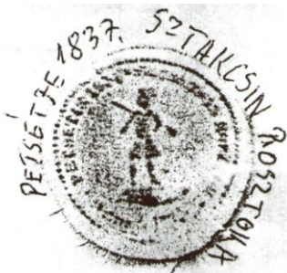
Pečať z roku 1837