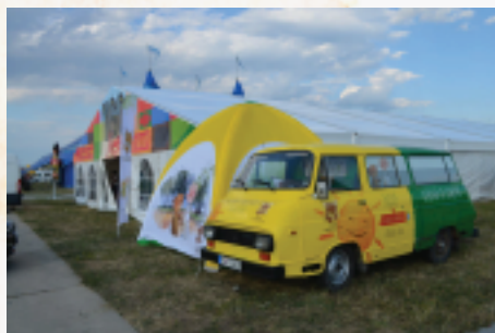
Zojka na festivale Pohoda 2017.

Auto Zojka bolo zároveň naším hlavným reklamným pútačom. Vďaka jednému oteckovi – dobrovoľníkovi, ktorý našiel, kúpil, opravil starú škodovku a aj sa spolu s nami postaral o jej nápaditý polep, mohlo naše auto vyraziť na letné festivaly. Topfest, Pohoda, Verím Pane, Žákovic Open, ale aj charitatívny tenisový turnaj boli jeho zastávky. Takto nastavená komunikačná a propagačná stratégia mala úspech. Ľudia všetkých vekových kategórií sa nestránili nášho auta a našej témy. Pristavovali sa, pýtali sa, vzali si naše letáky a mnohí aj symbolicky prispeli do našej verejnej zbierky pre zlepšenie podmienok prostredia na detskej onkológii. Trasu našej Zojky a informácie z jej zastávok na festivaloch, fotografie a videá sme zverejňovali na sociálnej sieti Facebook a na Instagrame. Táto naša osvetová kampaň mala úspech aj v celoslovenských médiách.