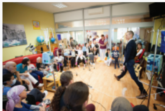
Návšteva olympijského víťaza Matej Tótha počas Týždňa deťom s rakovinou 2017.