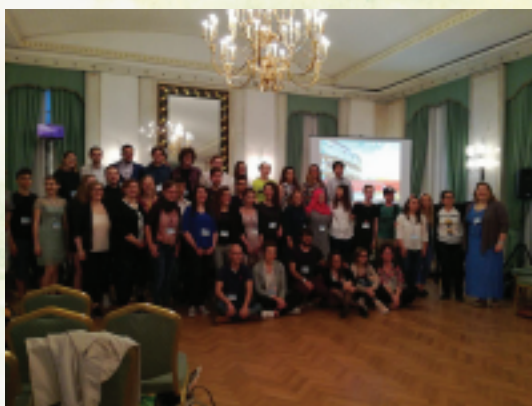
Foto školenie - CCI v Ríme v máji 2017

Ako členská organizácia medzinárodnej inštitúcie Childhood Cancer International (CCI), ktorá bola založená v roku 1994 a združuje 181 organizácií z 90 krajín sveta, sme sa zúčastnili konferencie CCI v Ríme v máji 2017. Hlavným poslaním je pomáhať onkologicky chorým deťom a ich rodinám a zasadzovať sa za právo každého dieťaťa s rakovinou na adekvátnu liečbu, podporovať výskumy nových liečebných postupov a robiť osvetu o téme detskej rakoviny. To boli aj hlavné tézy konferencie plus téma dôležitej následnej starostlivosti o odliečených pacientov s rôznymi neskorými následkami liečby, tzv. late effects.