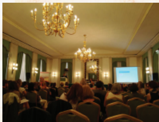
Foto školenie - CCI v Ríme v máji 2017