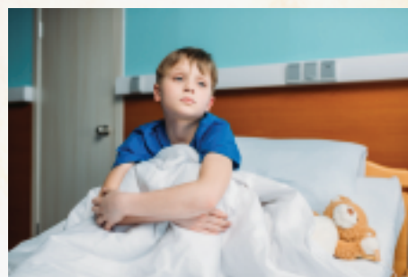
Rodiny na detskej onkológii potrebujú často psychologickú pomoc a aj iné adresné formy pomoci. Ilustračný záber.

Každá nová rodina po príchode na KDHaO dostáva od našej organizácie tzv. štartovací balíček. Jeho súčasťou sú základné hygienické a dôležité dezinfekčné prípravky a potreby, rehabilitačné pomôcky a tzv. Sprievodca pre rodičov. Deti sú prostredníctvom nás obdarúvané darčekom od sponzorov a individuálnych darcov (hračkami, stavebnicami, knihami, kresliacimi pomôckami, atď.)