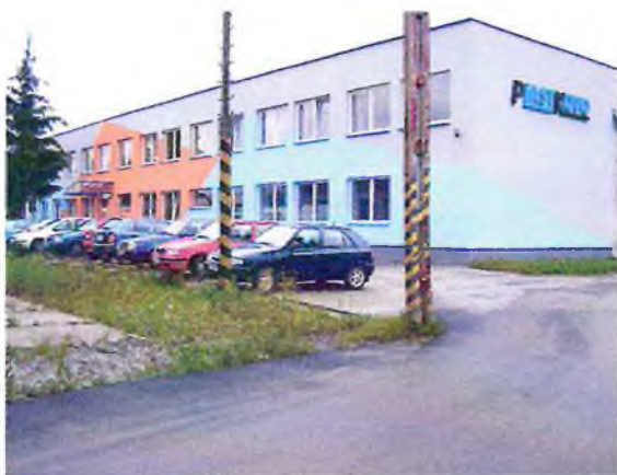
Výrobná hala KOVOLISOVNĀ