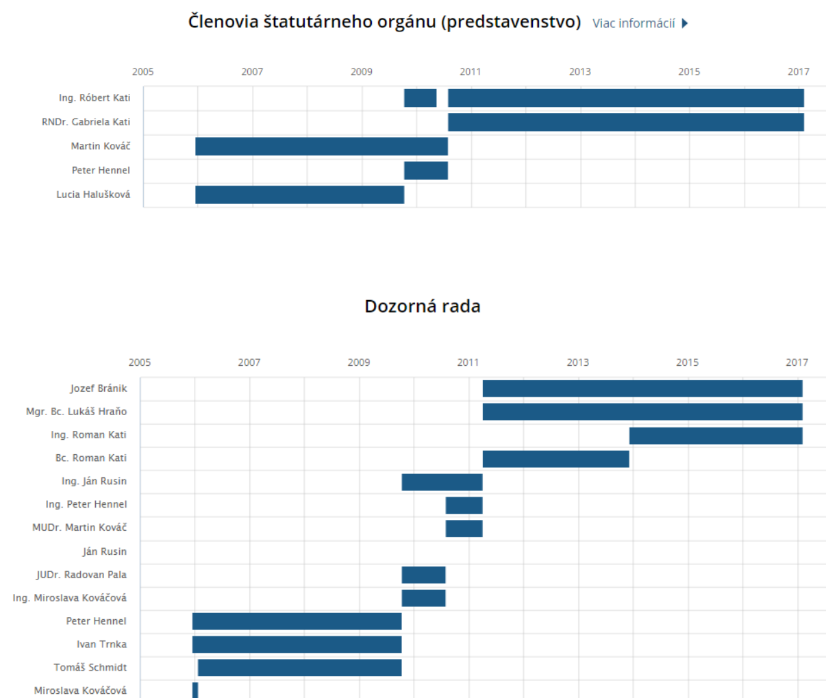
Obr. 2-2 Grafické znázornenie personálneho vývoja orgánov spoločnosti ECOWA, a.s

V nasledujúcej časti uvádzame kompletne údaje o personálnom vývoji orgánov spoločnosti, a to od jej vzniku až po súčasnosť: