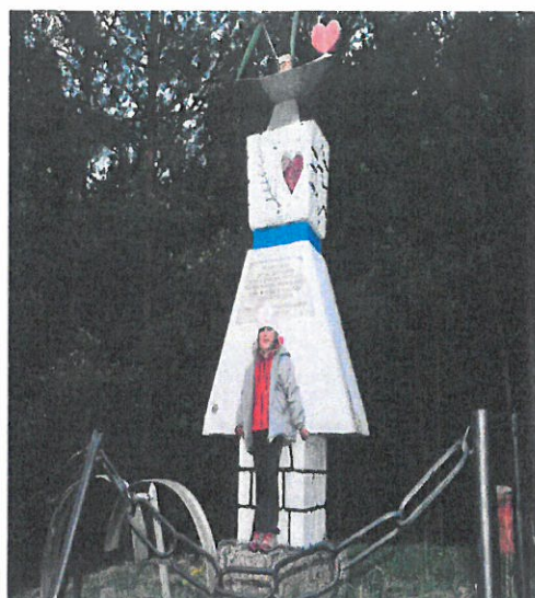
Pomník starých mládencov