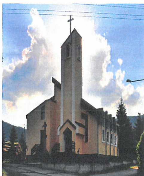
Kostol sv. Cyrila a Metoda