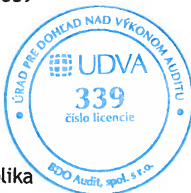
BDO Audit, spol. s r. o. Licencia UDVA č. 339

22. júna 2018 Zochova 6-8 Bratislava, Slovenská republika