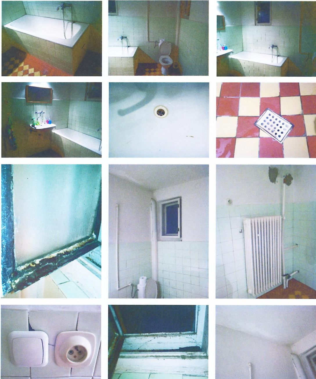
Príloha č. 2