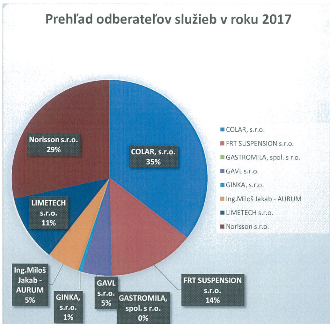
obr. č. 2

Prehľad najvýznamnejších odberateľov služieb z prenájmu je zobrazený na obrázku č. 2.